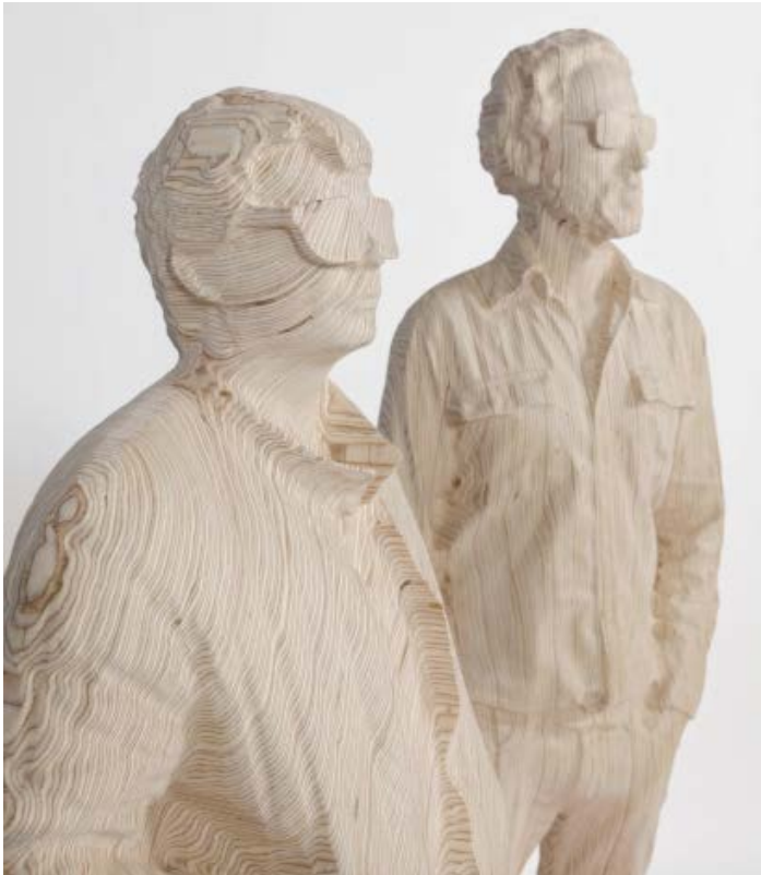
"Thomas Bangalter & Guy-Manuel de Homem-Christo" (detail), 2015 161 x 100 x 55 cm / 63 3 / 8 x 39 3 / 8 x 21 5 / 8 inches Contreplaqué de bouleau, peinture acrylique, vernis / Birch plywood, acrylic paint, varnish