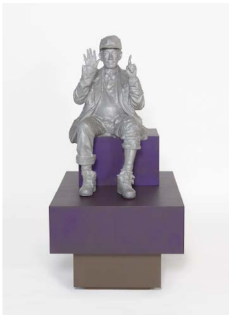
"Lee Scratch Perry" (2015) 122,5 x 62 x 86 cm / 58 1/2 x 24 4/8 x 33 7/8 inches Résine polyuréthane chargée aluminium, contreplaqué, peinture acrylique, vernis / Aluminium-filled polyurethane resin, plywood, acrylic paint, varnish

All images: Photo © Diane Arques; © Veilhan/ ADAGP, Paris/ ARS, New York, 2015 Courtesy Galerie Perrotin