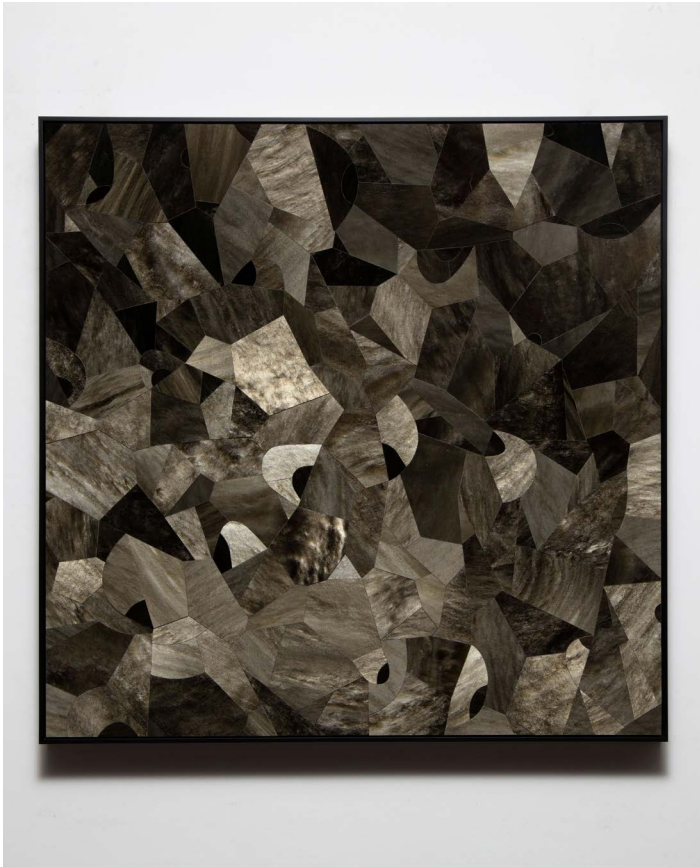
Gabriel de la Mora, 226 Ob.Ds. , 2024. Obsidian fragments on wood. Framed: 61.2 × 61.2 × 4.5 cm | 24 1/8 × 24 1/8 × 1 3/4 in. ©Gabriel de la Mora / ADAGP Paris, 2024. Courtesy of the artist and Perrotin.