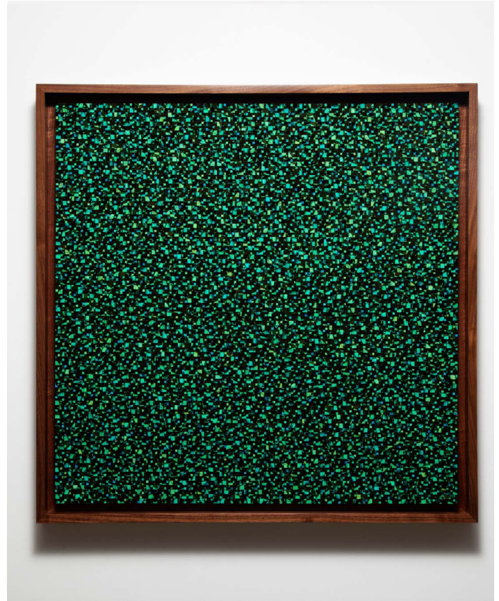
Gabriel de la Mora, 16,230 I Pa.Bi. , 2024. Doxocopa cherubina butterfly wings mosaic on museum cardboard. Framed: 65 × 65 × 6 cm | 25 9/16 × 25 9/16 × 2 3/8 in. ©Gabriel de la Mora / ADAGP Paris, 2024. Courtesy of the artist and Perrotin.