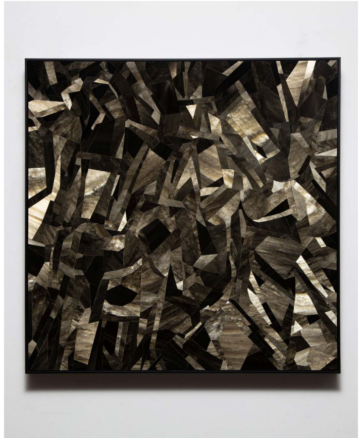
Gabriel de la Mora, 662 Ob.Ds. , 2024. Obsidian fragments on wood. Framed: 61.2 × 61.2 × 4.5 cm | 24 1/8 × 24 1/8 × 1 3/4 in. ©Gabriel de la Mora / ADAGP Paris, 2024. Courtesy of the artist and Perrotin.

pensée, dans sa forme logique la plus pure, est incapable de présenter ou de comprendre la véritable nature de la vie et la signification profonde du processus évolutif – en effet, la vie n'est pas entièrement compréhensible, car nous ne pouvons pas expliquer la disparition brutale de cette force après la mort.