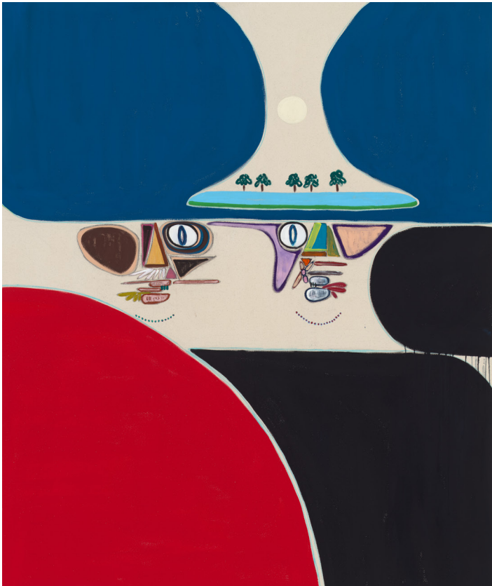
Far Away Eyes, 2022. Flashe vinyl paint and pastel pencil on canvas. 160 × 132 cm | 63 × 52 in.