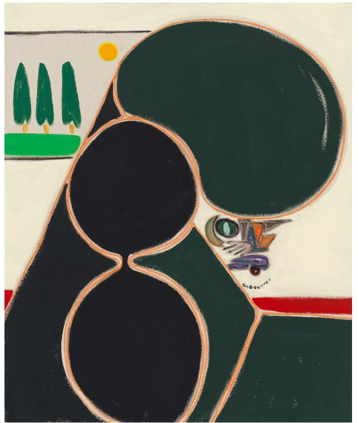
Cozy Royal , 2022. Flashe vinyl paint and pastel pencil on canvas. 60.9 x 50.8 cm | 24 x 20 in.

What we find is a master in the prime of his powers whose work fascinates and intrigues us. Kamijo, speaking in July, 2021 in a podcast, mentioned how painters are sometimes people who paint out of their own emotional bathtubs. Instead, the world that Kamijo invites us into is one where the poodles have advanced to the core of our line of vision, welded securely to the landscape where a serene line of trees align themselves wordlessly with the gnashing teeth of the poodle. He may not be painting out his emotional bathtub. We who encounter it look for a totem in the enigma, for the inkstone in the calligraphy of visceral gestures.