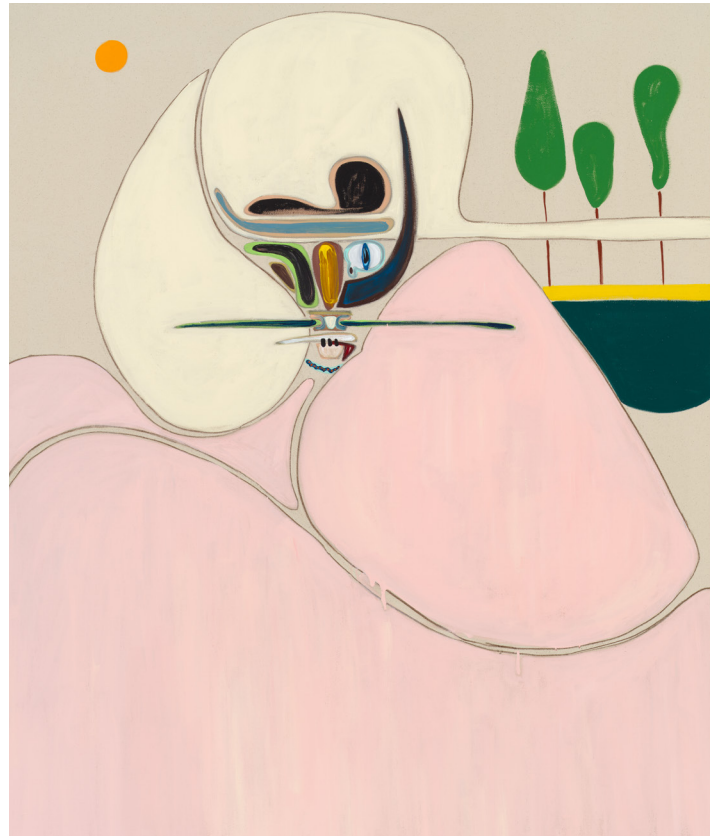
Solace, 2022. Flashe vinyl paint and pastel pencil on canvas. 160 × 132 cm | 63 × 52 in.