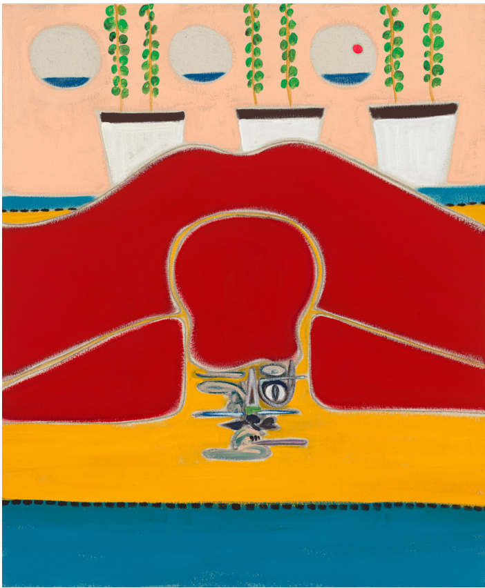
On the Voyage , 2022. Flashe vinyl paint and pastel pencil on canvas. 60.9 x 50.8 cm | 24 x 20 in.