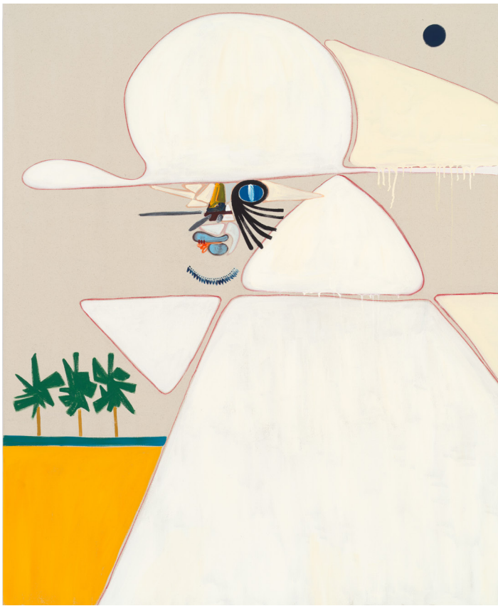
Gentle Mind , 2022. Flashe vinyl paint and pastel pencil on canvas. 160 × 132 cm | 63 × 52 in.

canvasses, a calligraphic meaning is always in a state of becoming; the nimbly drawn figures become poodles and figures that create a field of vision that invite a roving eye until fixated upon the ever-present dot that adorns every painting. The dot, often a point that contrasts with the colors on the canvas, is a ubiquitous presence that becomes a marker of narrative – in a minimal landscape, Kamijo's use of this dot is a compelling, almost intimate, legend in the austere field of vision.