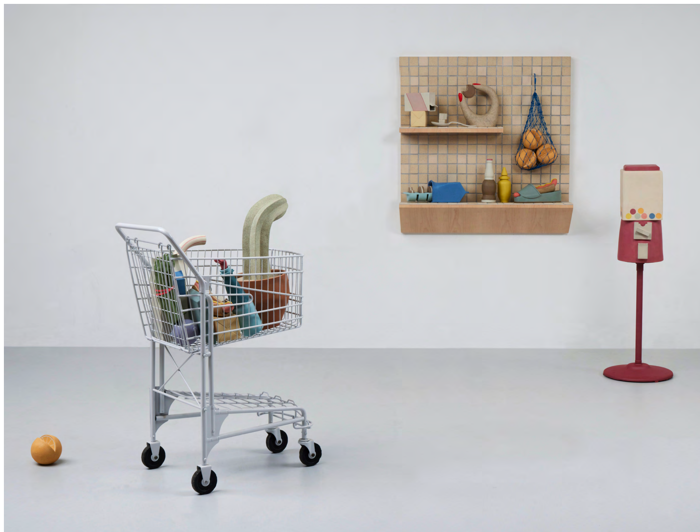
Healthy Living , 2022. Stoneware, powder coated steel, 200,3 × 62,2 × 45,7 cm | 39 1/2 × 24 1/2 × 18 in. Impulse Buy , 2022. Stoneware, plywood, twine, oil painted manicure, 101,6 × 91,4 × 25,4 cm | 40 × 36 × 10 in. Three for One , 2022. Stoneware, powder coated steel, 115,6 × 22,9 × 22,9 cm | 45 1/2 × 9 × 9 in.