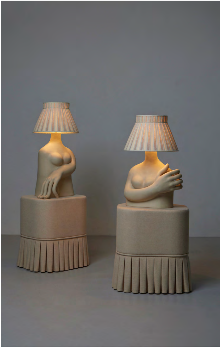
I Don't Believe in Ghosts; Flicker in the Ether , 2022. Stoneware, wool covered plywood, lamp hardware, lampshade, 160 × 53 × 43cm | 63 × 21 × 17in.