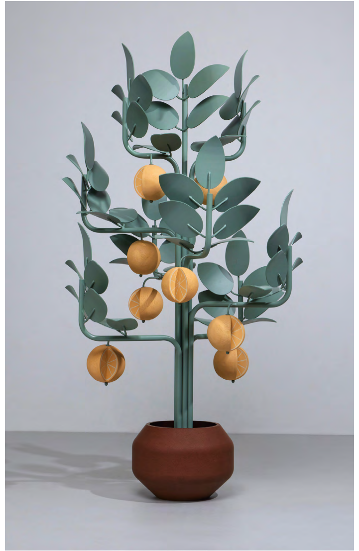
Waning Moons , 2022. Stoneware, powder coated aluminum, power coated steel. 152 × 84 × 84cm | 60 × 33 × 33in.

discount désert. Trois sculptures en céramique et en acier thermolaqué — un caddie, un rayonnage et un distributeur automatique — incarnent les espoirs déçus du rêve américain. Baptisé Healthy Living (La vie saine), non sans ironie, le caddie rutilant déborde de marchandises phalliques: une bouteille de soda affublée d'une langue ondulante, un carton de lait dont dépasse une paille tombante, une botte d'asperges amollies, un hot dog et un cactus en pot. La sculpture Impulse Buy est emblématique des dernières expérimentations de l'artiste en studio: des dioramas muraux ornés de camées personnalisés. Sur un fond de carreaux faits main, celui-ci présente des condiments, des sucreries, une main de femme manucurée et une chaussure. La pièce maîtresse de la salle est un distributeur de chewing-gums grande nature intitulé Three for One (Trois pour un). Son apparence joyeuse masque un récit plus sombre, fait de désirs absurdes et d'ambitions avortées.