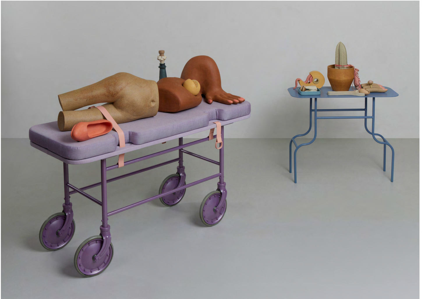
Minor Procedure , 2022. Stoneware, fabric covered cushions, powder coated steel, oil painted manicure, 137,2 × 152,4 × 61 cm | 54 × 60 × 24 in. Masculine Still Life (Keeping It Together) , 2022. Stoneware, powder coated steel, leather, oil painted manicure, 119,4 × 91,4 × 40,6 cm | 47 × 36 × 16 in.

tête découragée et d'une main tenant un miroir brisé sont étalés des comprimés, des ballons dégonflés et des sucreries raffinées. Sur une prise hors d'usage sont fixés de gros adaptateurs dont pendent deux câbles inutilisables. Un chœur de quatre bustes de servantes à la poitrine proéminente et joliment vêtue complète l'ensemble. Viennent-elles quitter la fête ou essayent-elles d'y entrer ?