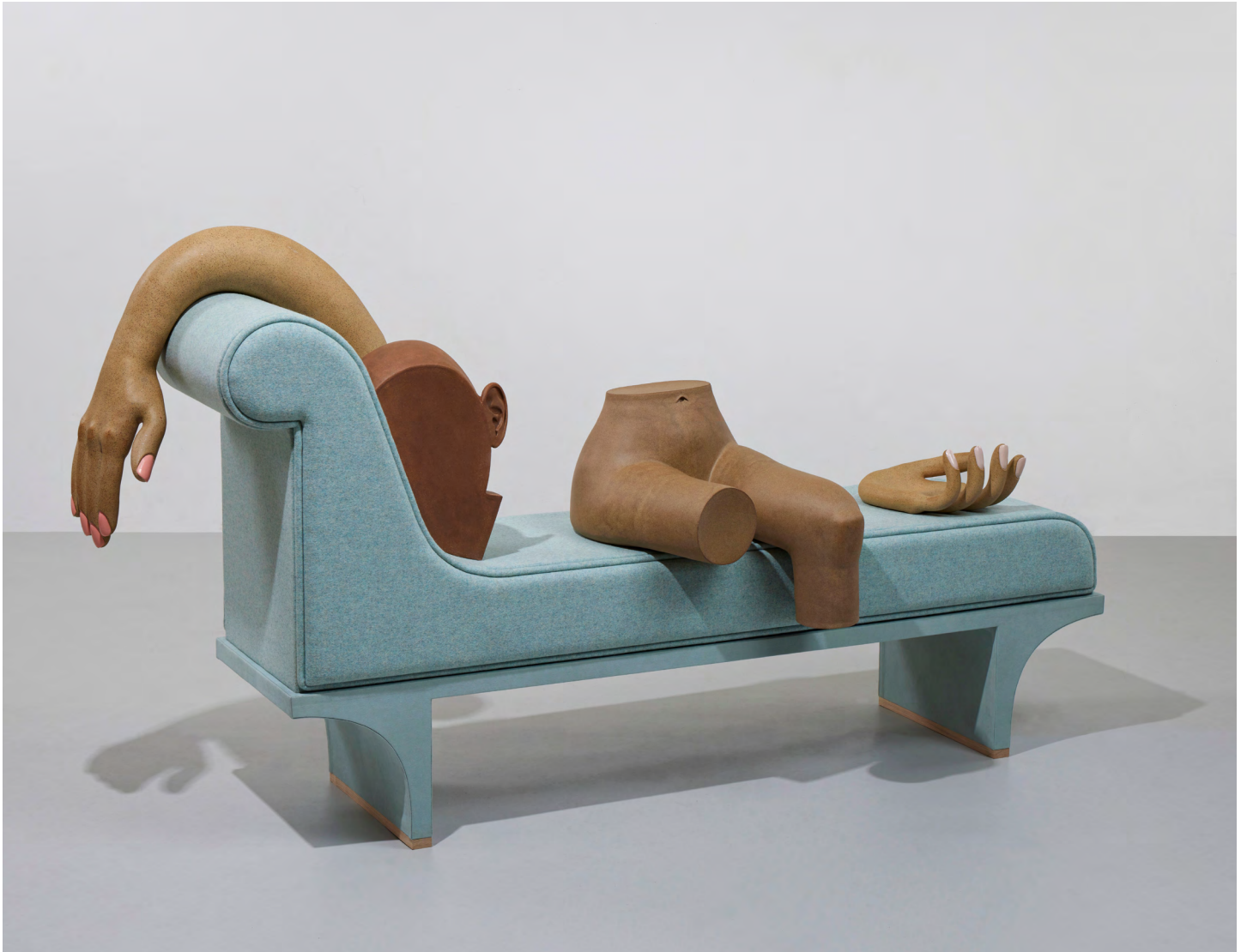
Nude in Repose , 2022. Stoneware, wool covered cushions, ultrasuede covered plywood, oil painted manicure, 1127 × 198 × 46cm | 50 × 78 × 18 1/2in.

sant par l'histoire de l'art, les objets à la fois maussades et fascinants sont ballottés au cœur d'un tourment hypercapitaliste. L'artiste manie glamour et humour comme des armes pour passer au crible un présent obsédé par l'image. Elle puise son inspiration aussi bien dans différents courants artistiques, tels que le baroque, le pop art, le surréalisme ou les imagistes de Chicago, que dans son expérience professionnelle dans le secteur de la mode. Les objets sont façonnés à la main à partir de motifs en deux dimensions, taillés dans des plaques d'argile étalées sur un plan de travail. Genesis Belanger y associe parfois du mobilier de son invention. Elle n'émaille jamais ses pièces de céramique, mais les pigmente avec des poudres colorées mélangées à l'aide d'un robot de cuisine. Sa palette de tons, douce et délicate, évoque l'esthétique des années 1950. Au fil du temps, ses installations et ses récits ont gagné en complexité. Elle compose des espaces où le temps est suspendu, densifié, tangible, qu'il s'agisse de salles d'attente, d'hôpitaux, de salons funéraires ou de salles de banquet. Le symbolisme de ses vanités évoque le désir et la tromperie, levant ainsi le voile sur les dimensions opposées intrinsèques aux objets du quotidien que nous consommons, que nous revêtons et que nous portons.