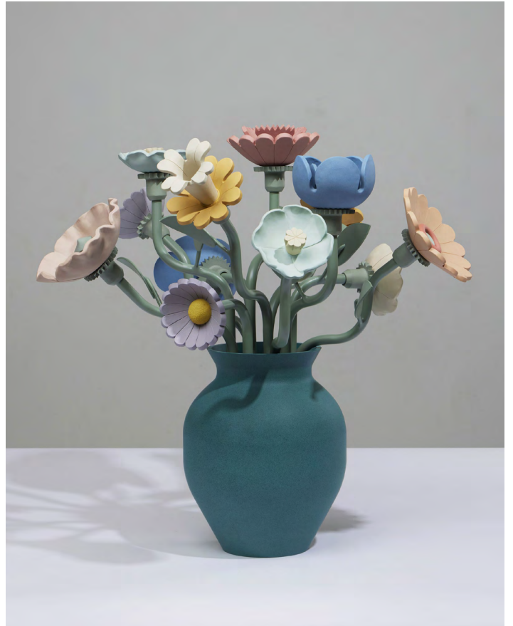
To All Your Future Endeavors , 2022. Stoneware, powder coated aluminium, powder coated steel, 57,2 × 48,3 × 43,2cm | 22 1/2 × 19 × 17in.

du tableau. Les images empruntent au vocabulaire féminin et populaire emblématique de l'artiste, que l'on retrouve tout au long de l'exposition : mains et pieds aux ongles vernis, comprimés aux teintes délicates, aliments typiquement américains et fleurs charnues.