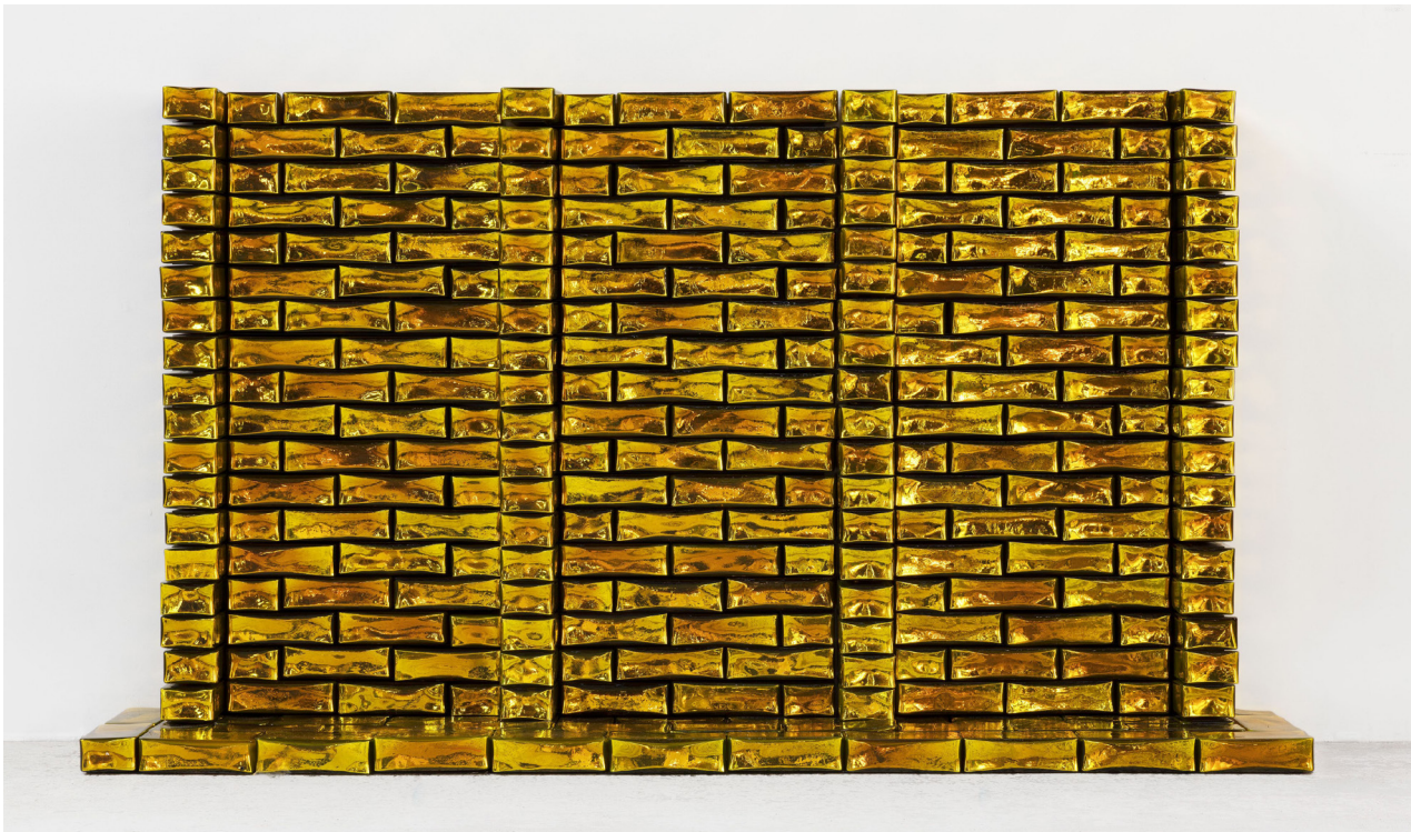
L'Autel ou le Parloir , 2019. Yellow glass bricks. 127 x 212 x 30 cm | 50 x 83 7/16 x 11 13/16 in © Jean-Michel Othoniel / ADAGP, Paris, 2019