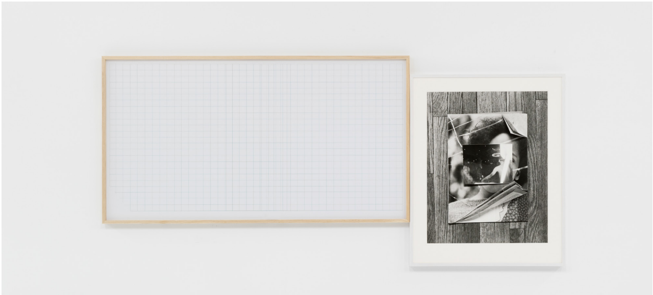
Riffs on Real Time with Ground (Green Mesh) , 2017 Digital chromogenic print, silver gelatin print. 104.1 x L. 231.1 cm | h. 41 x l. 91 in