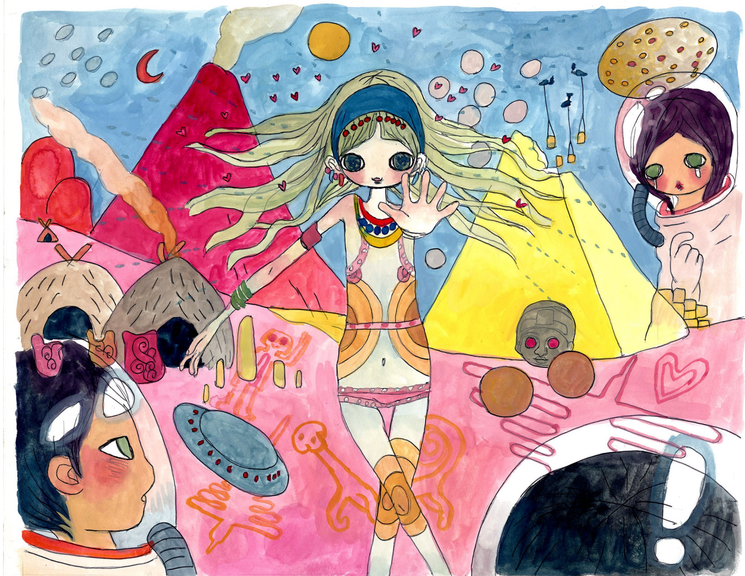
AYA TAKANO, Calendar of Love Vol. 51 We Were Told That We Mustn't Fall in Love with Anyone from This Undeveloped Planet, Earth. , 2007 Stylo à bille et aquarelle sur papier, 297 x 320 mm ©2007 AYA TAKANO/Kaikai Kiki Co., Ltd. All Rights Reserved. Courtesy Perrotin