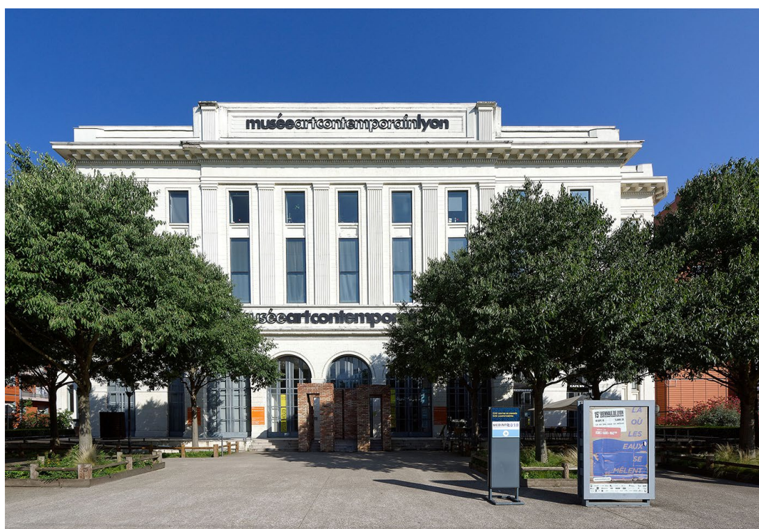
Vue du Musée d'art contemporain de Lyon. Œuvre de Per Kirkeby, A Spatial Ornament for the New Museum, 1987-2000

Réunies dans un pôle des musées d'art avec le musée des Beaux-Arts de Lyon en 2018, les deux collections forment un ensemble exceptionnel en France et en Europe, avec des pièces de l'Antiquité à nos jours.