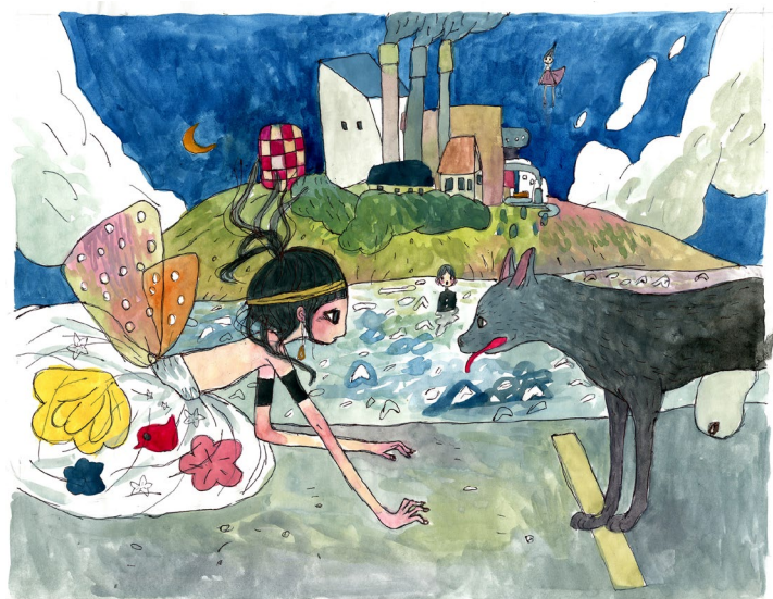
AYA TAKANO, Calendar of Love Vol. 59 It's True. I've Fallen in Love with Him. Having Said This, She Disappeared with the Dog. , 2008 Stylo à bille et aquarelle sur papier, 280 × 355 mm ©2008 AYA TAKANO/Kaikai Kiki Co., Ltd. All Rights Reserved.

Ce concept allie la culture japonaise traditionnelle au monde moderne, en s'inspirant de notions contemporaines comme celle d'« otaku », une personne qui consacre tout son temps à son hobby, de manière acharnée. Chiho Aoshima et AYA TAKANO sont aussi des artistes de Superflat , montrant l'histoire de la culture japonaise avec l'esthétique des mangas et animés.