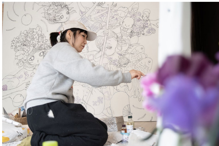
AYA TAKANO

AYA TAKANO semble désormais poursuivre une nouvelle quête artistique, à la fois plus humble et spirituelle, influencée par un intérêt inédit pour les sciences, et guidée par un respect absolu pour la nature et la vie humaine.