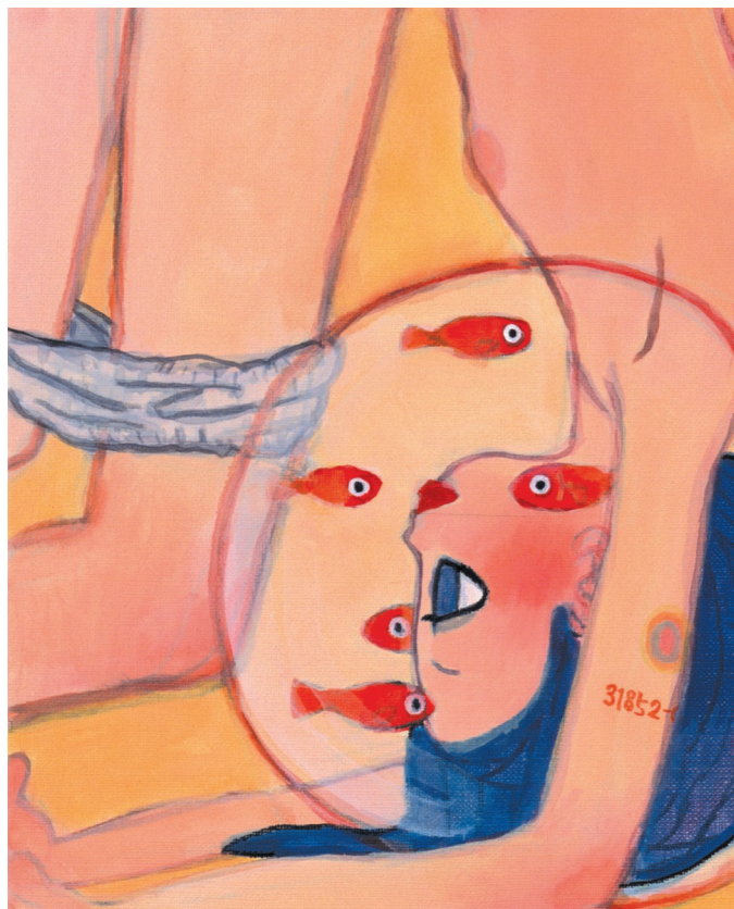
AYA TAKANO, 31852 , 1999 Acrylique sur toile, 280 × 220 mm ©1999 AYA TAKANO/Kaikai Kiki Co., Ltd. All Rights Reserved.