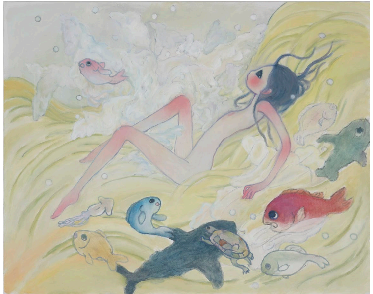
AYA TAKANO, Bitter-sweet-sour-tasting Primordial River in the Shape of All Things Glows and Cascades; Elation Begins , 2018 Huile sur toile, 727 × 910 mm ©2018 AYA TAKANO/Kaikai Kiki Co., Ltd. All Rights Reserved.