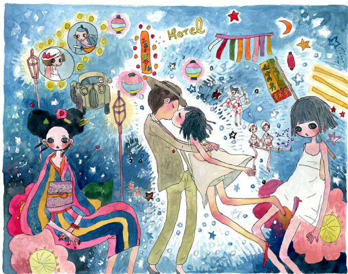
AYA TAKANO, Calendar of Love Vol. 57 In 1927, for Some Reason I Kissed the Girl Who Appeared Out of Thin Air. , 2008 Stylo à bille et aquarelle sur papier, 280 × 355 mm ©2008 AYA TAKANO/Kaikai Kiki Co., Ltd. All Rights Reserved. Courtesy Perrotin

AYA TAKANO crée un monde fluide et unique, dans lequel diverses références aux traditions ancestrales se mêlent à son univers personnel, qui emprunte des éléments à la science-fiction, au dessin animé, au rêve et à l'imaginaire. L'artiste a également réalisé de nombreuses collaborations avec des créateurs de mode, des marques de bijoux ou encore de cosmétiques. Ces différents objets se mêleront aux œuvres d'AYA TAKANO dans l'exposition, reflets de la richesse de la pratique de cette artiste.