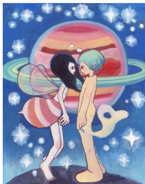
AYA TAKANO, Universe , 1998 Acrylique sur toile, 920 x 730 mm ©1998 AYA TAKANO/Kaikai Kiki Co.,Ltd. All Rights Reserved.

*Citation de l'artiste tirée du documentaire AYA TAKANO – Towards Eternity , réalisé par Hélène Sevaux.