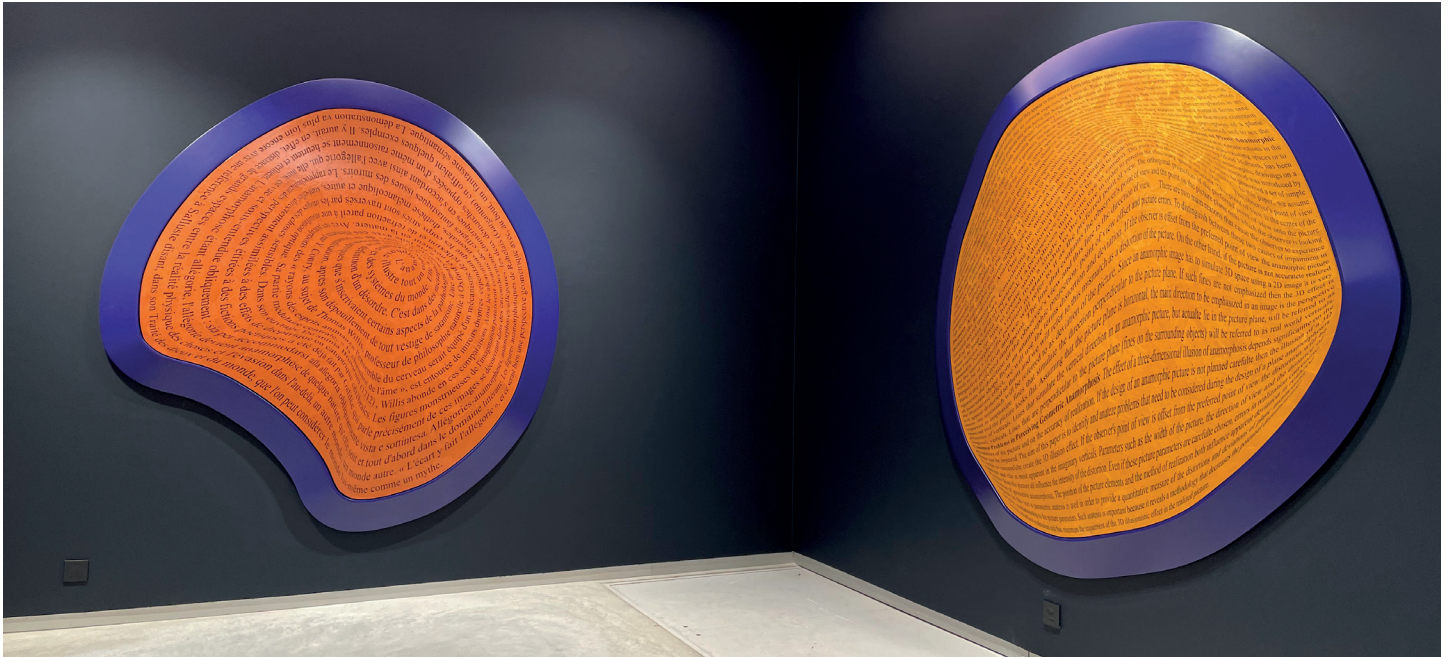
Vue d'exposition d' Anamorphoses , Guy Pieters Gallery, Knokke-Heist, Belgique, 7 août — 12 septembre 2021. Exhibition view of Anamorphosis , Guy Pieters Gallery, Knokke-Heist, Belgium, 7 August — 12 September 2021.

En regroupant sculptures, reliefs, peintures, dessins et gravures, l'exposition met en évidence toute l'étendue de son œuvre protéiforme. Réparti de façon inédite sur les trois espaces de la galerie Perrotin, cet événement majeur apparaît comme une célébration de l'un des artistes les plus importants de sa génération autour d'un ensemble récent n'ayant jamais été exposé dans une institution parisienne.