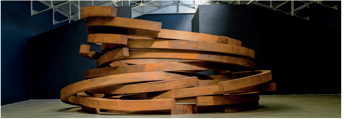
Empilement : 18 Arcs / Stack: 18 Arcs, 2022. Acier Corten | Corten-steel. 317 x 700 x 630 cm. ©Bernar Venet.