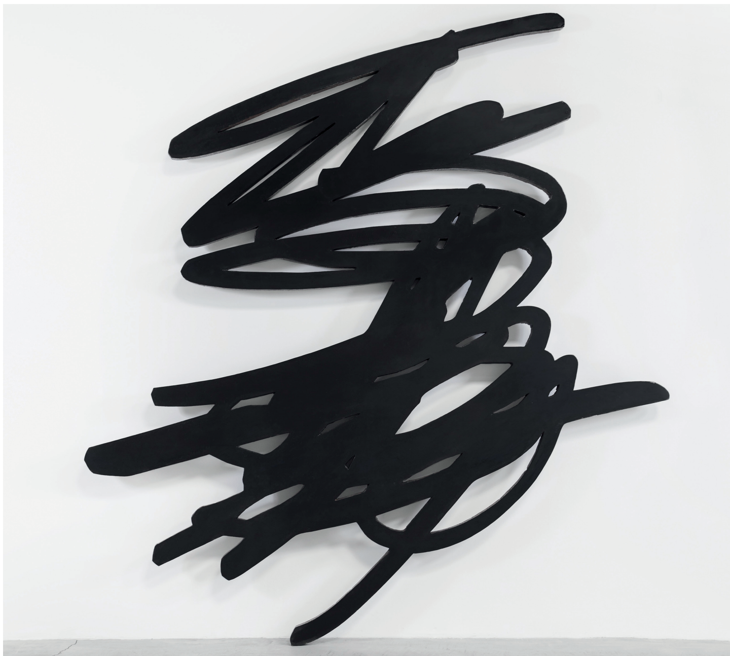
Grib 1 , 2011. Acier oxycoupé et ciré | Torch-cut waxed steel. 225 × 215 × 3,5cm. Crédit photo | Photo credit: Jerome Cavaliere ©Bernar Venet.