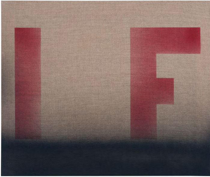
Ed Rusha, ff , 2007, Acrylic on linen, 20 1/8 x 24 1/8 in.