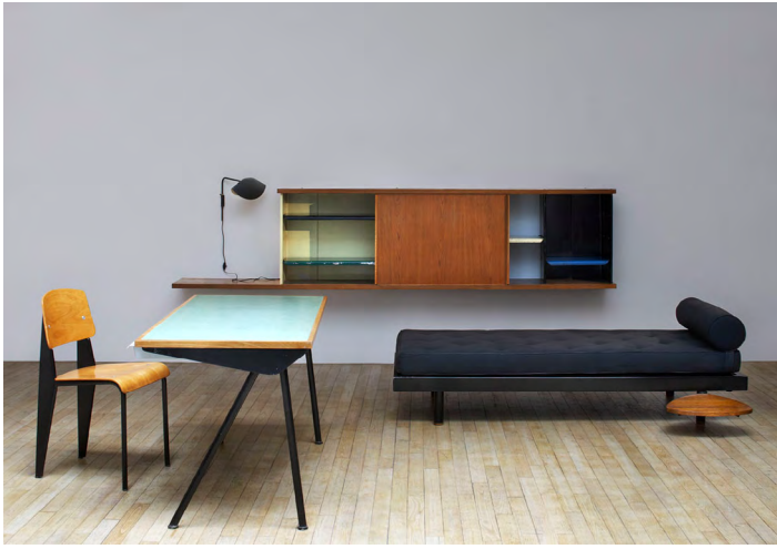
Ensemble de la cité universitaire Antony, réalisée par Jean Prouvé, 1954. ©Jean Prouvé / ADAGP Paris, 2023. Courtesy of Laffanour / Galerie Downtown Paris and Perrotin.