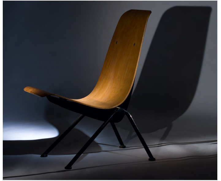
Jean Prouvé, Antony armchair, Ca. 1954. Black lacquered bent steel structure, molded plywood seat. H. 85,7 x L. 50,2 x P. 68,2 cm | H. 33.7 x W. 19.8 x D. 26.8 in. ©Jean Prouvé / ADAGP Paris, 2023.

Figure emblématique de l'aventure moderniste au XX e siècle, Jean Prouvé (1901-1984) fut à la fois architecte, ingénieur, constructeur et designer. Homme engagé dans les réflexions sociales de l'après-guerre, le créateur nancéien conçoit des meubles pratiques aux formes épurées ayant pour but l'alliance entre l'art et l'industrie. Il utilise une approche à la fois fonctionnelle et humaniste pour mettre ses créations à la portée de tous. Après ses débuts dans la ferronnerie d'art (pratique à l'origine de remarquables rampes d'escaliers, lampes, grilles d'ascenseur, ferronnerie de portes) il se tourne rapidement vers la construction architecturale suite à la découverte de la soudure et de l'acier inoxydable. L'idée maîtresse de Jean Prouvé est celle du principe constructif, selon lequel « il n'y a pas de différence entre la construction d'une maison et celle d'un meuble ». Ses bâtiments comme ses meubles exposent leurs systèmes d'articulation et d'assemblage, dévoilent les forces en présence qui s'exercent les unes contre les autres, tels que les piètements de sa chaise standard, « en forme d'égalité résistance », pensée pour ne pas casser quand on se balance.