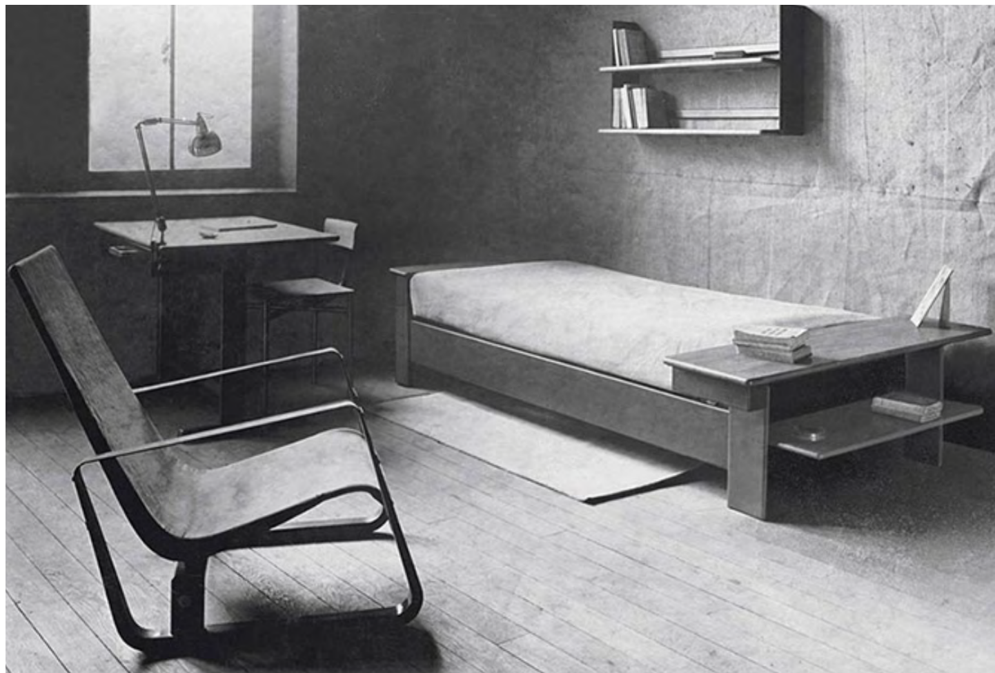
Jean Prouvé, Prototype of a dormitory room presented for the competition for the furnishings of the new Cité universitaire de Nancy, France, c. 1930: Cité armchair, bed, table and chair. ©Jean Prouvé/ADAGP Paris, 2023. ©Centre G. Pompidou, Paris, Bibliothèque Kandinsky, fonds Jean Prouvé. Courtesy of Laffanour/Galerie Downtown Paris and Perrotin.