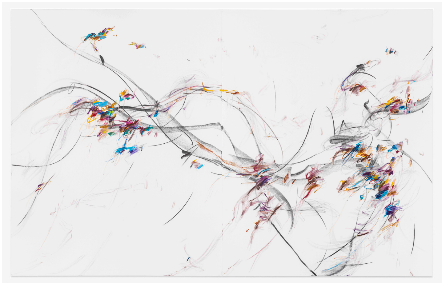
Xiyao Wang, Allongé no. 1 , 2023. Oil stick, charcoal on canvas. 190 x 300 cm | 74 13/16 x 59 1/16 in.