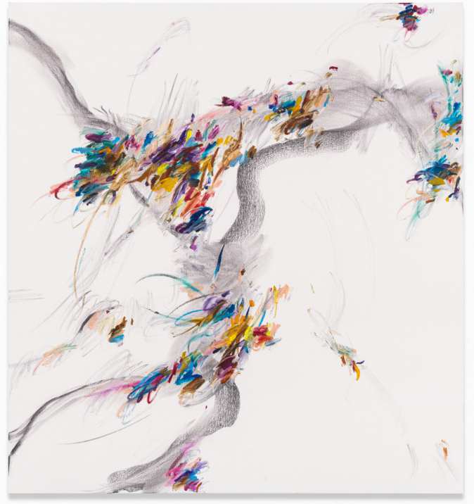
Left: Xiyao Wang, Relevé no. 2 , 2023. Oil stick, charcoal on canvas. 135 × 125 cm | 53 1/8 × 49 3/16 in. Photo: Studio XW. Courtesy of the artist and Perrotin. Right: Xiyao Wang, Saute de Basque no. 5 , 2023. Oil stick, charcoal on canvas. 135 × 125 cm | 53 1/8 × 49 3/16 in. Photo: Studio XW. Courtesy of the artist and Perrotin.

the frequent verbal cues that ballet dancers receive throughout their training is allongé , a French term which reminds dancers to elongate their position at the beginning or end of a movement by extending their arm(s) and focusing their attention on the continuity of line that their body creates. In this respect, allongé is a centering mechanism through which the dancer's breath, body tension and mental concentration become fully integrated—either in a moment of preparation that channels their energy toward realizing the prescribed movement to the best of their ability, or an act of completion that aids in sustaining their physical and mental intensity until the movement has fully subsided.