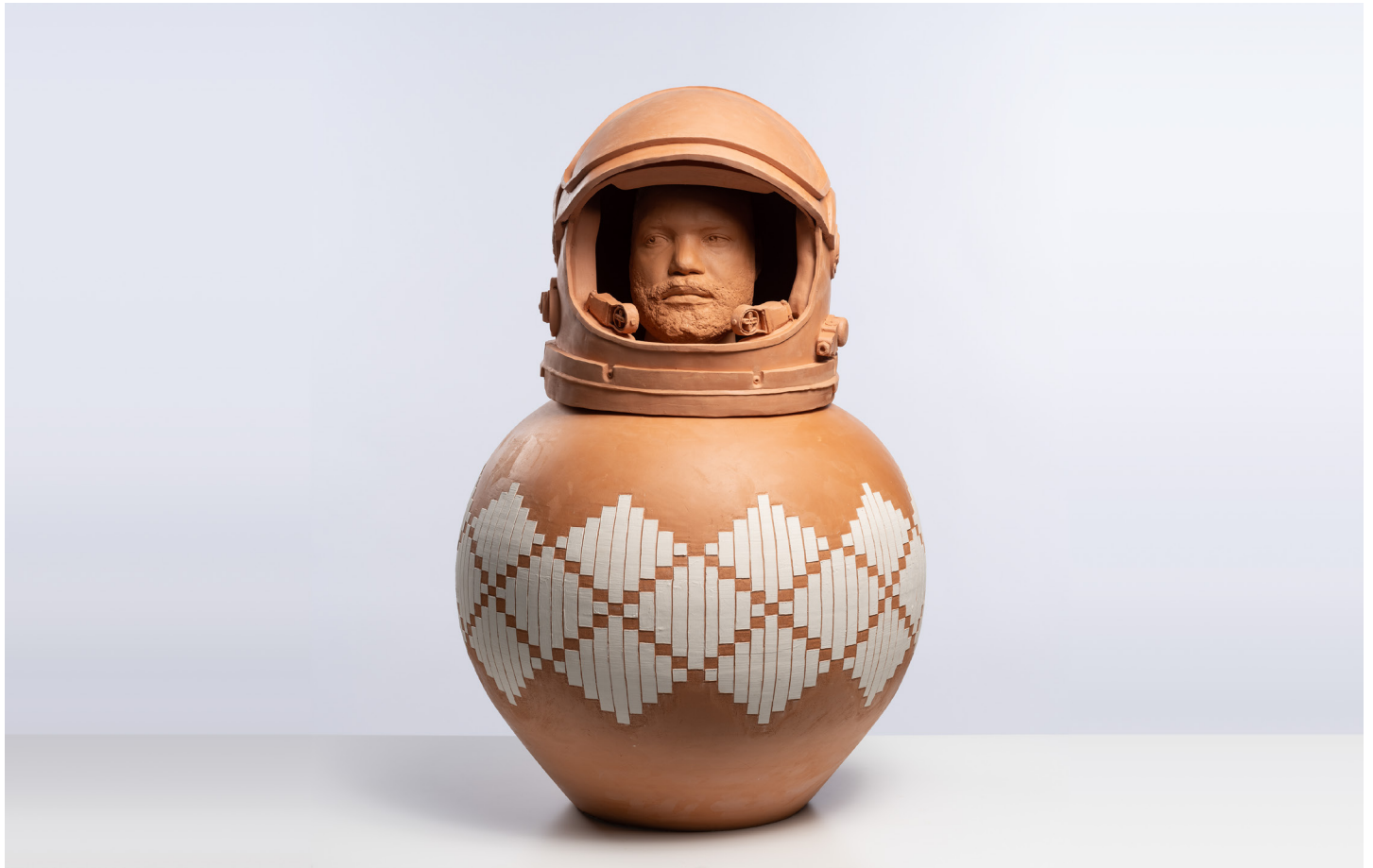
Tavares Strachan, Self Portrait (Space Helmet) , 2023. Ceramic; two parts, Overall dimensions: 90 × 60 × 60 cm | 35 7/16 × 23 5/8 × 23 5/8 in.