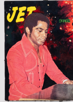
Tavares Strachan, Changes , 2022. Jet magazine, oil, enamel, pigment, acrylic, 19.1 × 13.3 cm | 7 1/2 × 5 1/4 in.

The breaking and reformulation of associations between image, text, and context become overwhelming in large-scale paintings such as Self Portrait: Loyalty to the Past (Blue Guro Mask) (2023). The diptych is a who’s who of the Strachaniverse, alluding to longstanding artistic preoccupations through overlapping elements that span an astronomical chart, pages from The Encyclopedia of Invisibility , a French-colonial postal stamp depicting a Togolese woman, and a leopard-print bust of American abolitionist Harriet Tubman (c. 1820–1913) sculpted by the artist. On the left-hand panel is a photograph of him in a spacesuit, taken during his cosmonaut training in Russia for an earlier project titled Orthostatic Tolerance (2006–2008). His face, though, is hidden under a superimposed picture of a Guro mask. With its profuse and complexly layered clues, the painting evokes an infinite puzzle. Tonally, too, it is hard to decipher, with the brutality of racism and slavery colliding with the wonders of space travel.