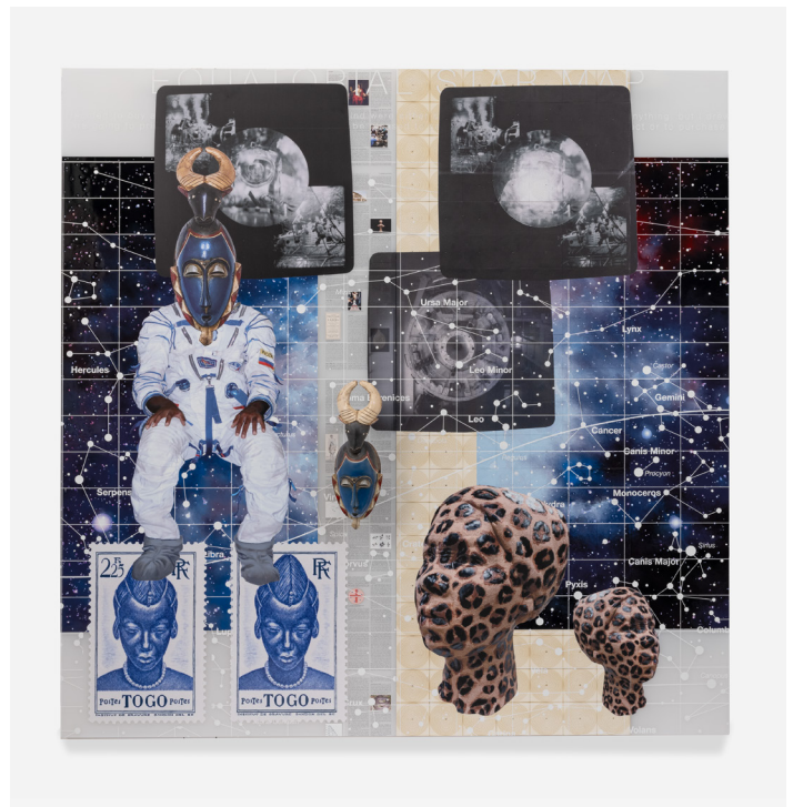
Tavares Strachan, Self Portrait: Loyalty to the Past (Blue Guro Mask) , 2023. Oil, enamel, pigment, museum board, brass armature, and Guro mask (Ivory Coast) on acrylic; two panels, Overall dimensions: 182.9 × 182.9 × 5.1 cm | 72 × 72 × 2 in.

One of the recurring figures in Strachan’s oeuvre is the Jamaican activist and entrepreneur Marcus Garvey (1887–1940). An advocate of Pan-Africanism who was influential between the First and Second