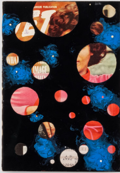
Tavares Strachan, What Image , 2022. Jet magazine, oil, enamel, pigment, acrylic, 19.1 × 13.3 cm | 7 1/2 × 5 1/4 in.

World Wars, Garvey founded the Universal Negro Improvement Association and African Communities League in Kingston before relocating to Harlem in New York City, where he also published the widely circulated Negro World newspaper and ran the transatlantic Black Star Line. It is a 1920s flyer for this shipping company, exhorting Black working men to “DO and BE,” that gave Strachan’s current show its title. The phrase appears again in a glass-beaded curtain, spelled out in pendulous azure baubles that distort the letters as they sway—a whimsical subversion of the grandiloquent source material, which employs aspirational rhetoric to equate the purchase of Black Star Line shares with the fulfillment of individual and collective potential.