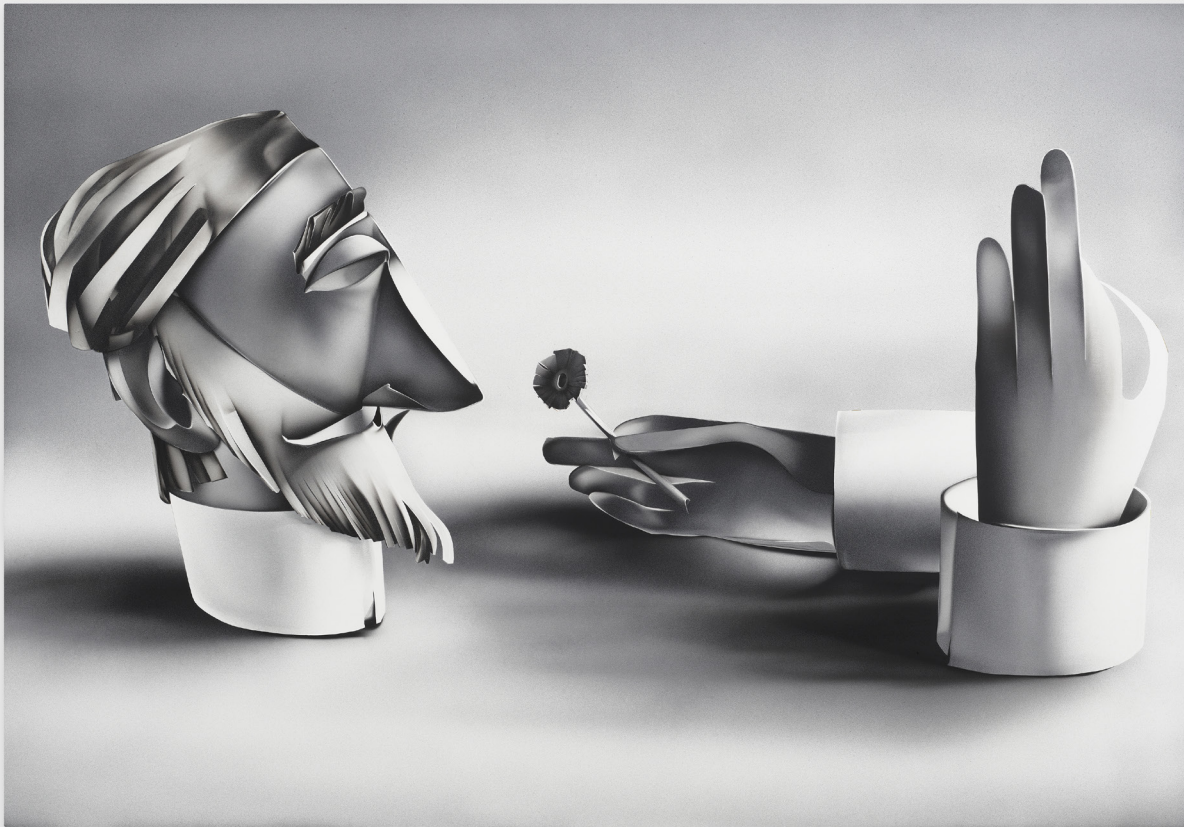
Love, peace and harmony? Oh very nice, very nice. But maybe in the next world. (The Decollation of Alan Watts / Grooving on the Eternal Now as Sacrament), 2023. Acrylic and polymer automotive paint on canvas. 81.4 x 117 cm.