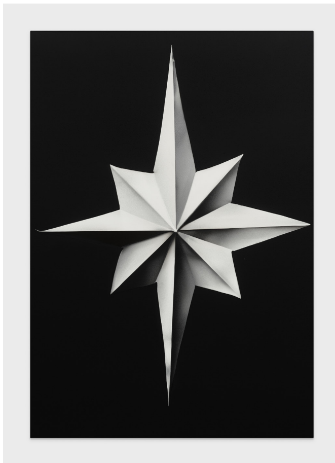
second star to the right, and straight on 'til morning, 2023. Acrylic and polymer automotive paint on canvas. 84.1 × 58.7 cm.

The composition of her painting is often straightforward, typically occupied by the frontal close-up of a single object, such as in, “ my whole world's turned amphetamine blue, now I'm livin' without you ” (2023), a seashell floating in a void. However, in, “ NOPE (After Magritte and Peele) ” (2023), a flower looms above layers of rippling waves, the composition nods to René Magritte’s The Treachery of Images .