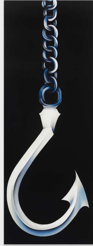
Left: NOPE (After Magritte and Peele) , 2023. Acrylic and polymer automotive paint of canvas. 183 × 152.6 cm. Photo: Marten Elder. Courtesy of the artist and Perrotin Right: [Hook] Repeat this Hook line, over and over, until you've got it Memorized , 2023. Acrylic and polymer automotive paint on canvas. 160 × 58.6 cm. Photo: Marten Elder. Courtesy of the artist and Perrotin

present days. Joslyn's solo exhibition Please Throw Me Back In The Ocean is a presentation of recent paintings that range in scale from intimate to larger-than-life. Unfolding, across three rooms and two floors, these works bring together the artist's reflection on her cultural experience of living in California and her inquiry into the collective desires and memories conditioned by the consumer capitalism of Americana. Fiercely precise and remarkably illusionistic, Joslyn's paintings—in grayscale and stark contrast—of a constellation of geometric and angular paper sculptures of seashell, compass rose, doll, mask and hook are derived from photographed images in her collection of books on paper craft.