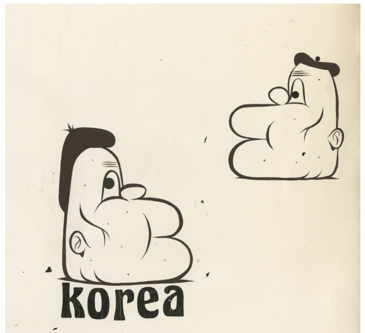
© Barry McGee; Courtesy of the artist, Perrotin, and Ratio 3, San Francisco.

Yet, of course, art institutions do still exist. And, so, the enactment of McGee's othering narrative can be encountered as a kind of theater. We suspend disbelief upon entering an exhibition of his work, taking in his portraits and tableaux as if they not only represent a real world of outsiders and the dispossessed (they do) but were also made for that world (they were not). This is not at all to say that McGee has "sold out," strategically creating images of otherness for consumption by the capitalist elite. No. What he has done, however, is make art that draws, richly, on his experiences in the counterculture. That the