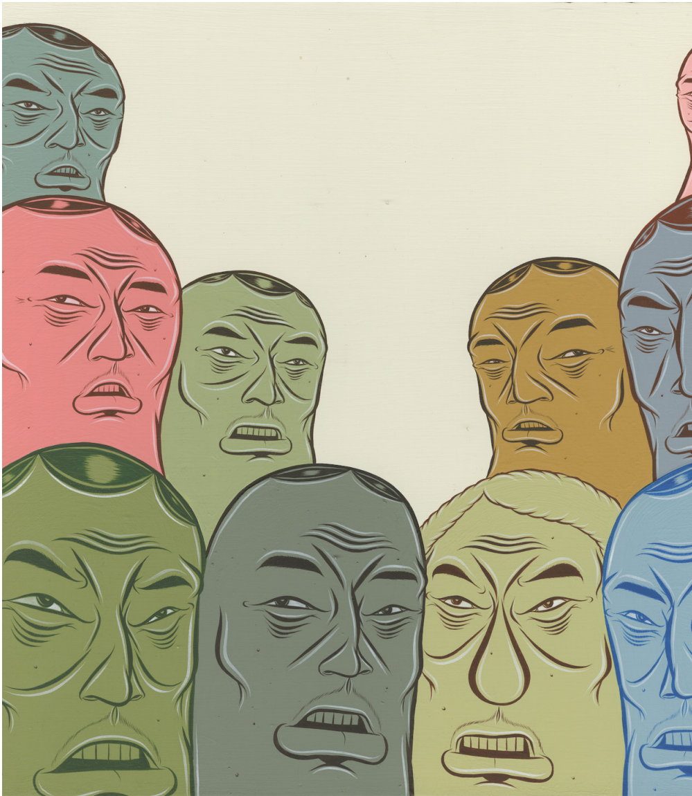
© Barry McGee; Courtesy of the artist, Perrotin, and Ratio 3, San Francisco.