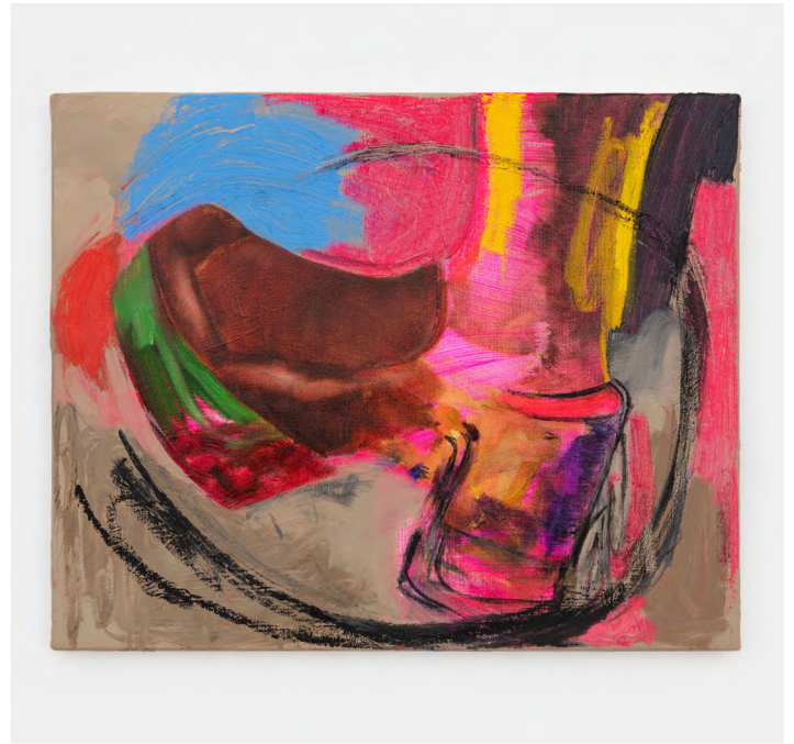
Dora Jeridi, 2022. Oil on canvas, 41 x 33 cm | 16 1/8 x 13 in.

Finalement la mémoire, même précise, des souvenirs d'enfance de l'artiste pourrait avoir une fonction de dépistage sur ses recherches esthétiques et iconographiques de peintre adulte. Car le temps, dans la peinture, coule dans toutes les directions, vers le passé sans doute mais aussi vers l'intemporel.