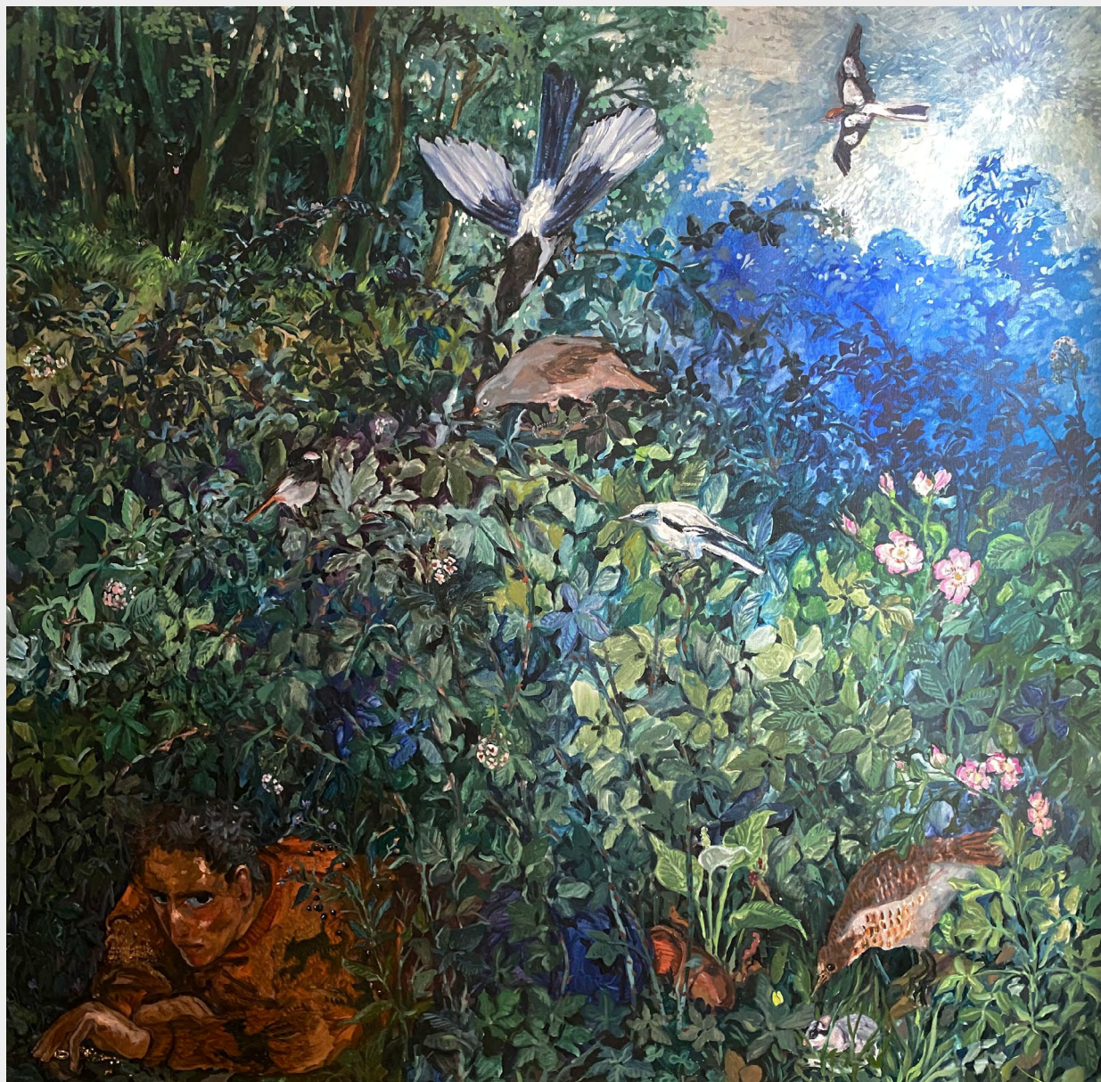
Adrian Geller, Hide and Seek , 2022. Oil on canvas, 180 x 180 cm | 70 7/8 x 70 7/8 in.