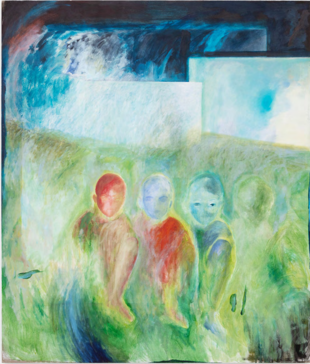
Nino Kapanadze, Hide and Seek (Cache-cache) , 2022. Oil on canvas, 210 x 180 x 3,5 cm.

Nino Kapanadze est née en 1990 à Tbilisi, Géorgie.