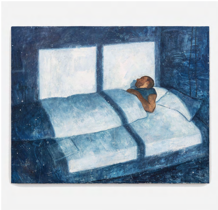
Nathanaëlle Herbelin, Sleep , 2022. Oil on canvas, 73 x 92 cm. ©Nathanaëlle Herbelin / ADAGP Paris, 2022. Courtesy of the artist, Jousse Entreprise and Perrotin.

À travers une série d'une vingtaine d'œuvres, cette exposition nous invite à l'interprétation des souvenirs d'enfance des artistes.