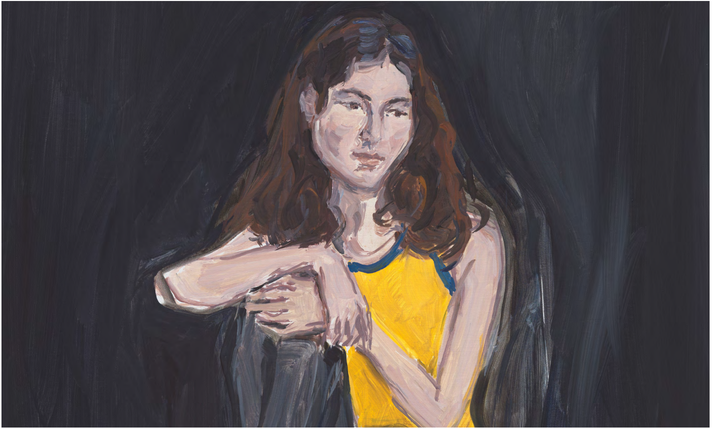
Jean-Philippe Delhomme, Talia (detail), 2023. Oil on canvas, wood frame. Framed: 65 x 54 cm | 25 9 / 16 x 21 1 / 4 inch.