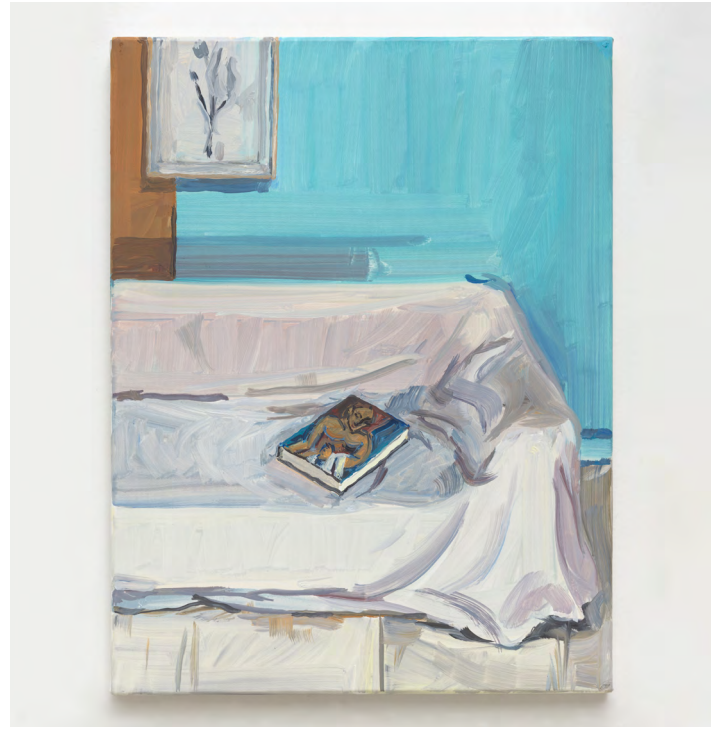
Jean-Philippe Delhomme, Resting Picasso , 2023. Oil on canvas, wood frame. Framed: 39 x 31 cm | 15 3 / 8 x 12 3 / 16 inch.

As a counterpoint to visage(s) at Perrotin, Delhomme will present The Studio , a selection of works displayed in the exhibition space