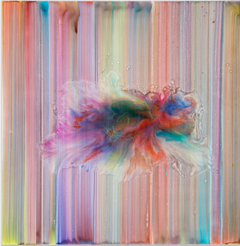
Ader, 2022. Acrylic and resin on canvas. 160 x 157 cm | 63 x 61 13/16 inch.