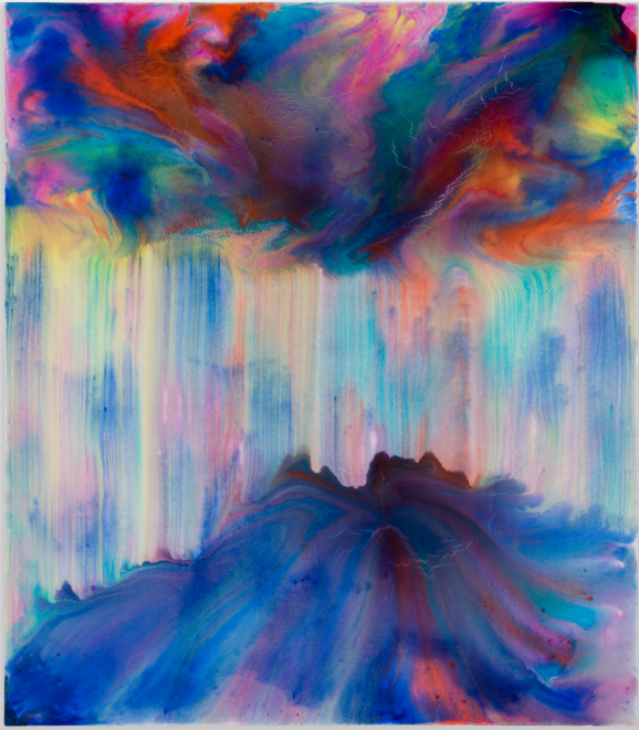
Iseg , 2022. Acrylic and resin on canvas. 160×140 cm | 63×55 1/8 inch.

now in his 70s. I assure you that Frize, who has devoted more than half of his life to creative experiments and journey of exploration, presents even more complex sensorial paintings to the world this time around. Paradoxically, we will find a very young and attractive Frize through his new works; the artist certainly is Frize but he is not. The former Frize is a painter who intentionally set aside his opinion as an artist and mechanically repeated the act of painting with the work protocol that “rules can set you free.” The elderly artist completed his unique style of abstract painting where the intersections of the vertical and the horizontal and traces of regular brushstrokes became both the form and content of painting through such practice. Yet the new Frize—or Frize of 2022 who painted new works—returned, having abandoned even the artistic achievements and the signature look of his paintings that he established over decades as if they are trivial elements of his work and practice. Or to be more dramatic, his current paintings appear as though they are creations of a young and free spirit who hops on the canvas, explodes energy, and becomes a particle in the air, dancing. Through my metaphoric expression above, one could imagine just how creative Frize's new abstract series is.