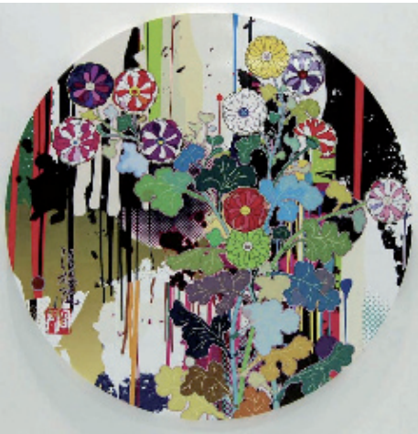
I Recall The Time When My Feet Lifted Off The Ground, Ever So Slightly. - Kōrin - Chrysanthemum, 2009 Acrylique et feuille d'or sur toile montée sur bois Diamètre: 150 cm

Takashi Murakami est né en 1962 à Tokyo, Japon. Il vit et travaille à Tokyo, New York et Los Angeles.