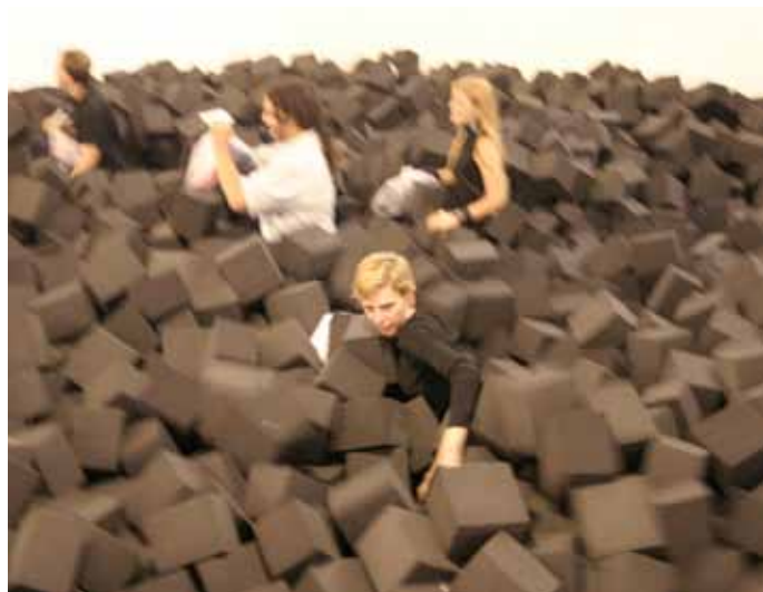
SUN YUAN & PENG YU , «The strongest dragon gets across the river», 2005