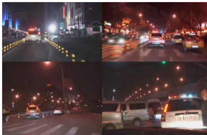
SUN YUAN & PENG YU , «I don't sleep tonight», 2010