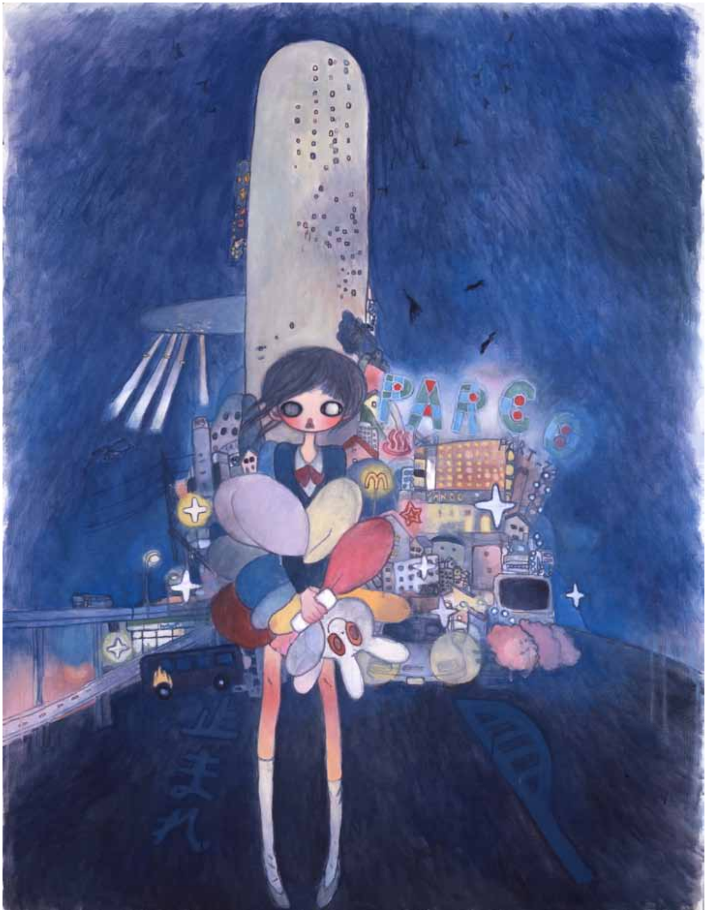
Aya TAKANO «Hoshiko the city child», 2006