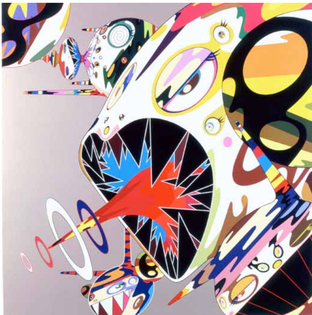
Takashi MURAKAMI «Homage to Francis Bacon (Study of Isabel Rawsthorne)», 2002