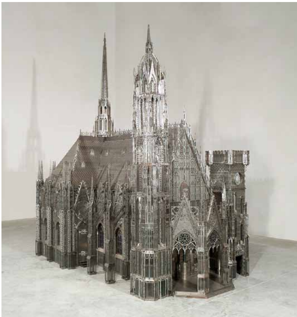
Wim DELVOYE «Chapelle», 2008