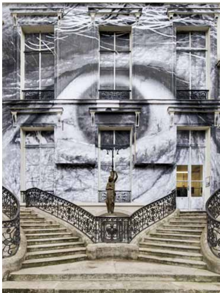
JR «The Wrinkles of the City, Los Angeles, Robert's eye», 2011