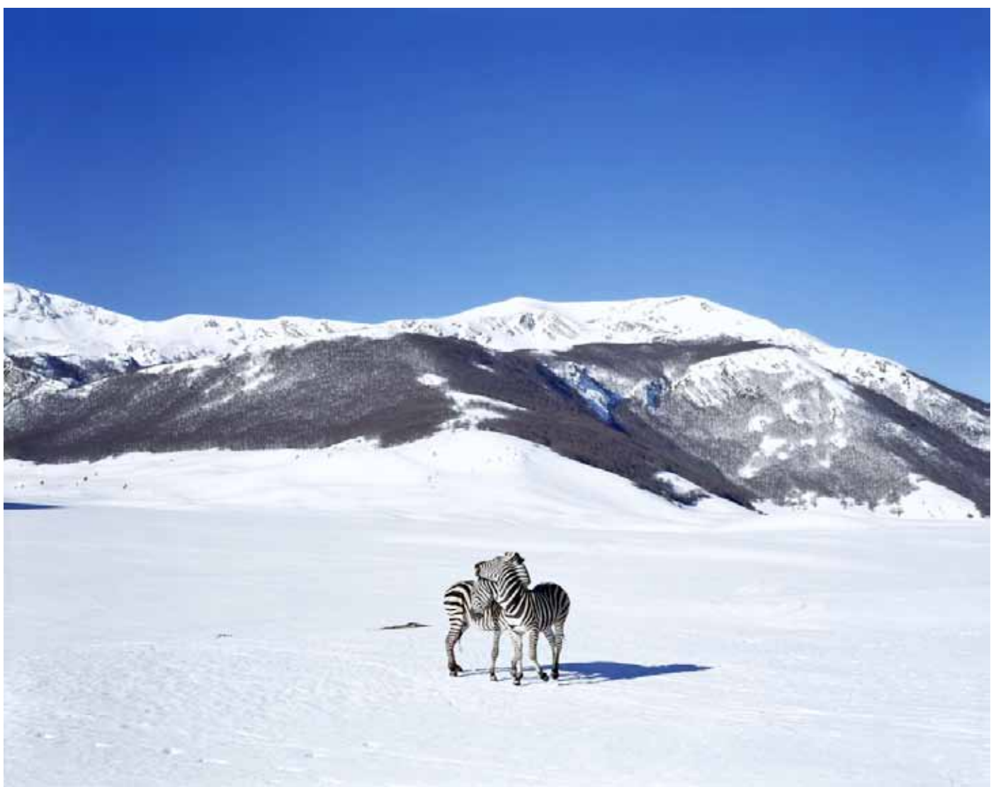
Paola PIVI «Untitled (Zebras)», 2003