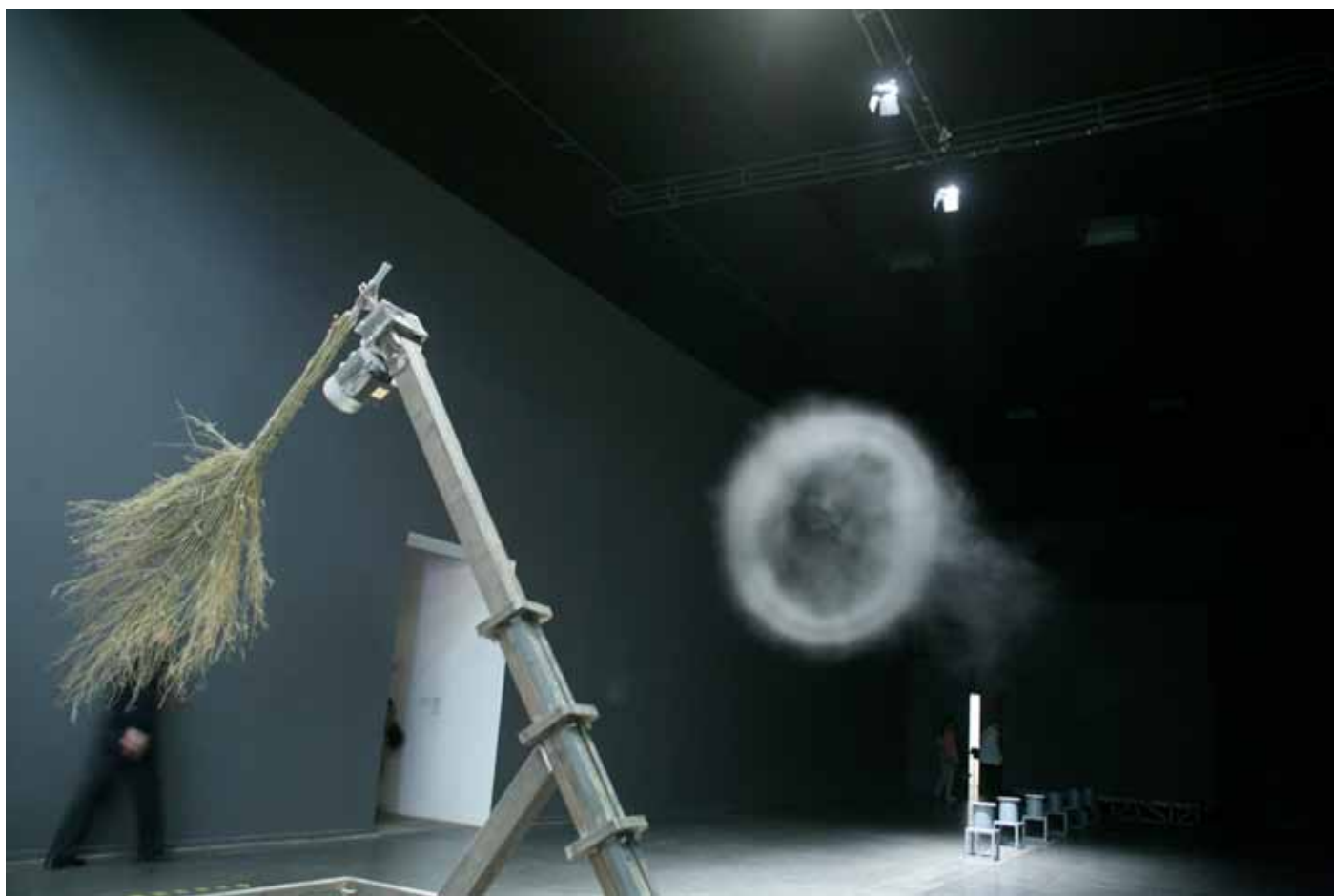
SUN YUAN & PENG YU , «Sun Yuan & Peng Yu», 2009