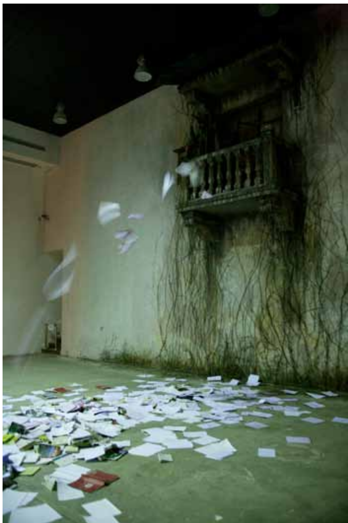
SUN YUAN & PENG YU , «Occasional awakening», 2008