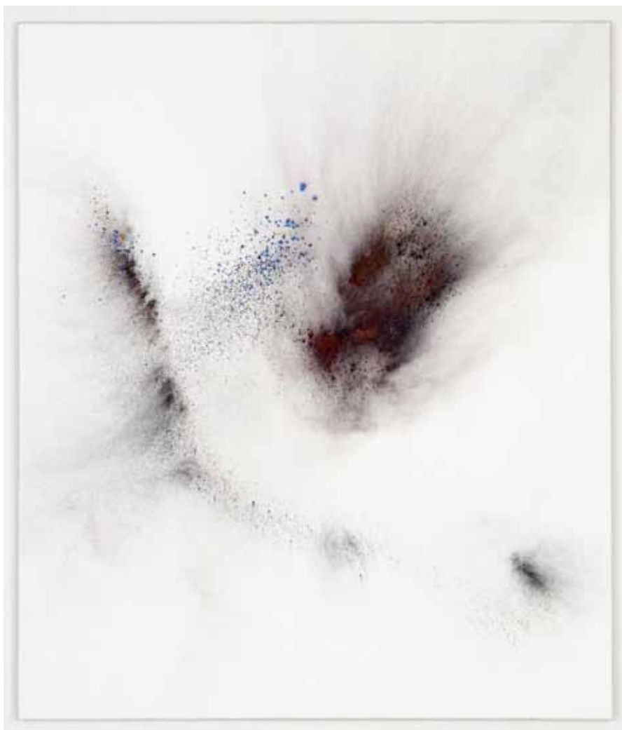
Thilo HEINZMANN «O. T.» 2012