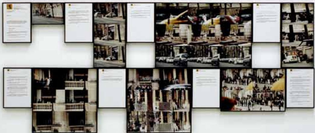
Sophie CALLE «Vingt ans après» / «Twenty Years Later» (détail/detail), 2001