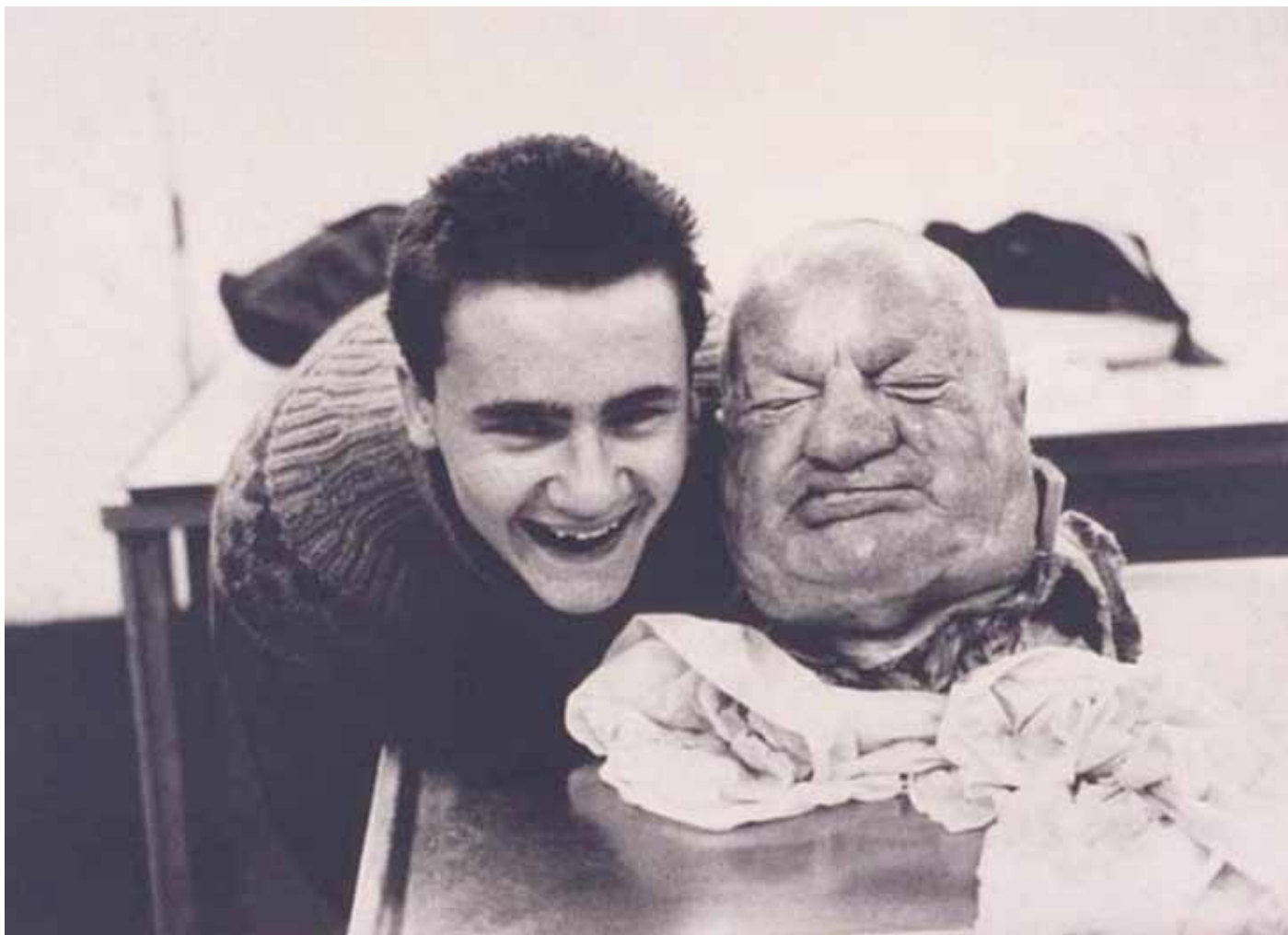
Damien HIRST «With Dead Head», 1991