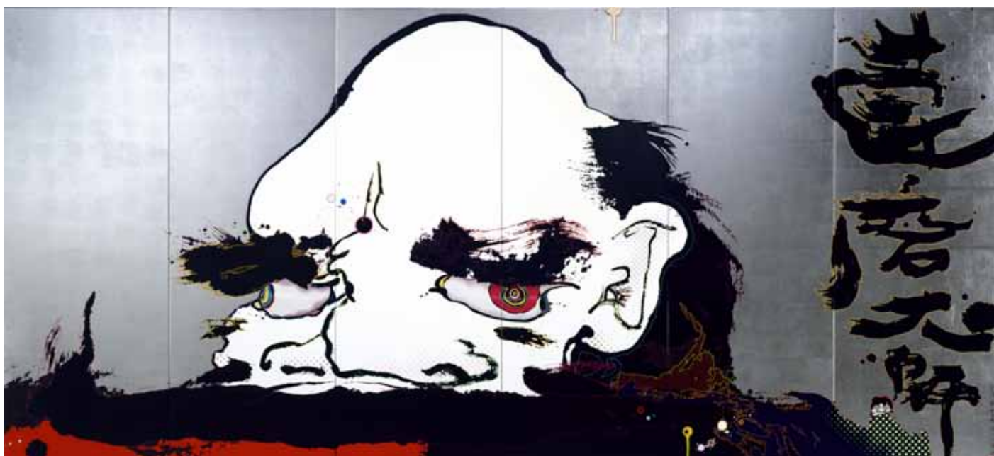
Takashi MURAKAMI «Daruma The Great», 2007