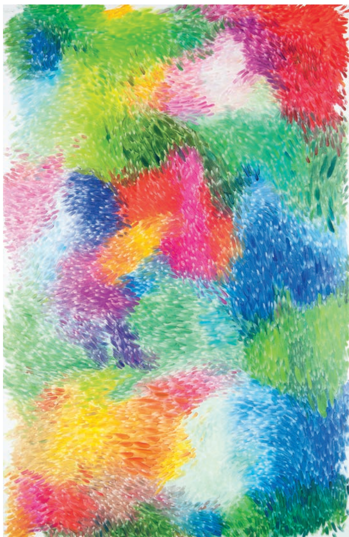
"fleur" 2014 Huile sur toile / Oil on canvas, 250 x 160 cm / 98 1/2 x 63 inches.

PETER ZIMMERMANN «sur le motif» Galerie Perrotin, Paris / June 12 - July 26, 2014 Press preview: Thursday June 12, 10am-12pm