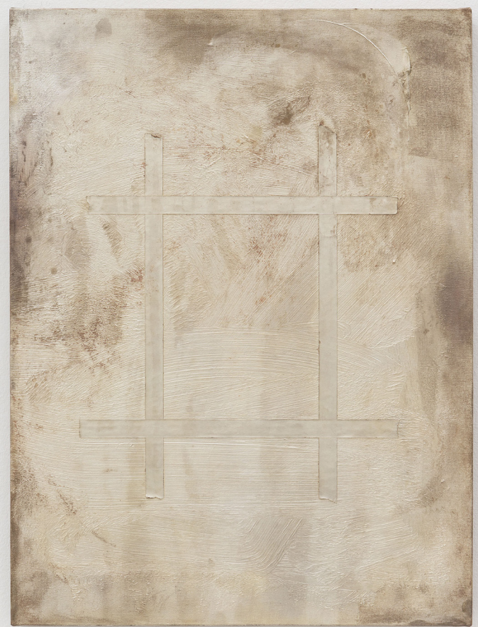
"Type", 2016 Galvanotype de cuivre / Copper electrotype 61 x 45.7 cm / 24 x 18 inches.