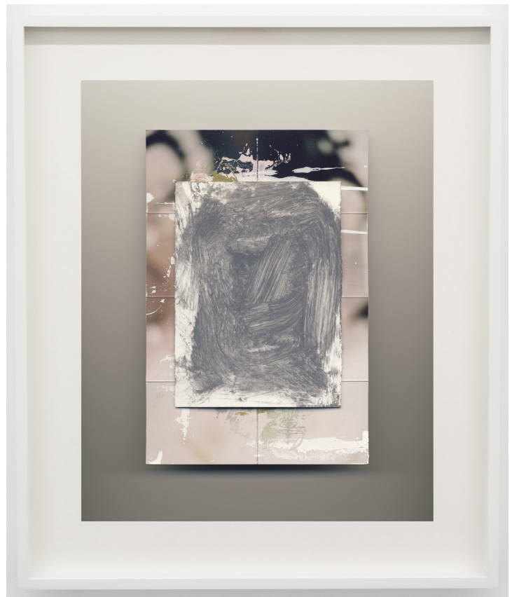
"Flowers", 2016 Photographie couleur, encadrement / Colour photograph, frame 64.1 x 54 cm / 25 1/4 x 21 1/4 inches