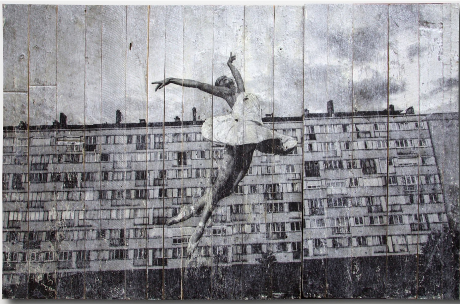
"28 Millimètres, Portrait d'une génération, Les Bosquets, Jeté cambré, Montfermeil, France, 2014" Encre sur bois / Ink on wood 228 x 366 cm / 89 3/4 x 144 1/8 inches