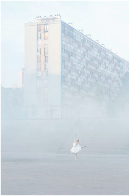
"28 Millimètres, Portrait d'une génération, Les Bosquets, In the Mist, Montfermeil, France, 2014" Photographie couleur, plexiglas mat, aluminium, bois / Color photograph, mat plexiglas, aluminum, wood 270 x 180 cm / 106 5/16 x 70 7/8 inches