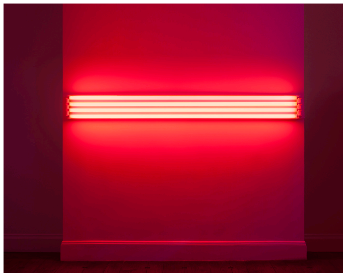
«four red horizontals (to Sonja)», 1963 Lampe fluorescente rouge 22 x 243,8 cm

Dan Flavin est né en 1933 dans le Queens à New York. Il a préparé le Séminaire à Brooklyn. En 1953, il s'engage dans l'US Air Force où il est technicien météo. Il commence à collectionner et fabriquer des oeuvres tout en visitant assidûment les musées de Washington et New York. A la fin des années 50, Dan Flavin intègre Columbia pour y étudier l'histoire de l'art. Son oeuvre a fait l'objet de nombreuses grandes expositions dont celles au Museum of Contemporary Art, Chicago (1967), à la National Gallery of Canada, Ottawa (1969), au Staatliche Kunsthalle, Baden-Baden (1989), et «Dan Flavin : A Retrospective», une exposition itinérante organisée par la Dia Foundation en association avec la National Gallery of Art, Washington, D.C (2004–2007) qui a été montrée au Museum of Contemporary Art, Chicago ; au Museum of Modern Art, Fort Worth, Texas ; à la Hayward Gallery, London ; au Musée d'Art Moderne de la Ville de Paris ; à la Pinakothek der Moderne, Munich ; et enfin au Los Angeles County Museum of Art. En 1983, The Dan Flavin Art Institute in Bridgehampton, New York, est inauguré dans une ancienne caserne des pompiers. En 1992, il crée une installation monumentale pour la réouverture du Guggenheim, New York. Dan Flavin décède en 1996, après avoir conçu son ultime oeuvre dans la nef et le chœur de la Chiesa Rossa à Milan.