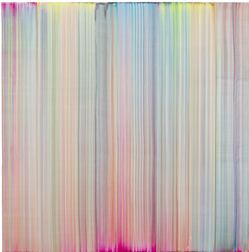
"Dola" 2013 Acrylique et résine sur toile / Acrylic and resin on canvas 180 x 160 cm / 70 3/4 x 63 inches